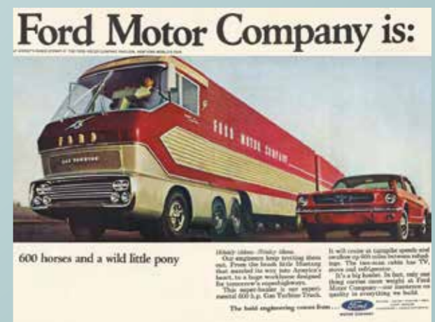
■ Skupinové foto pro reklamní účely Fomoco. Menší bratr se měnil podle umístění propagačního snímku: americký Mustang nebo britská Cortina Mk.I. Oboje bylo efektní...