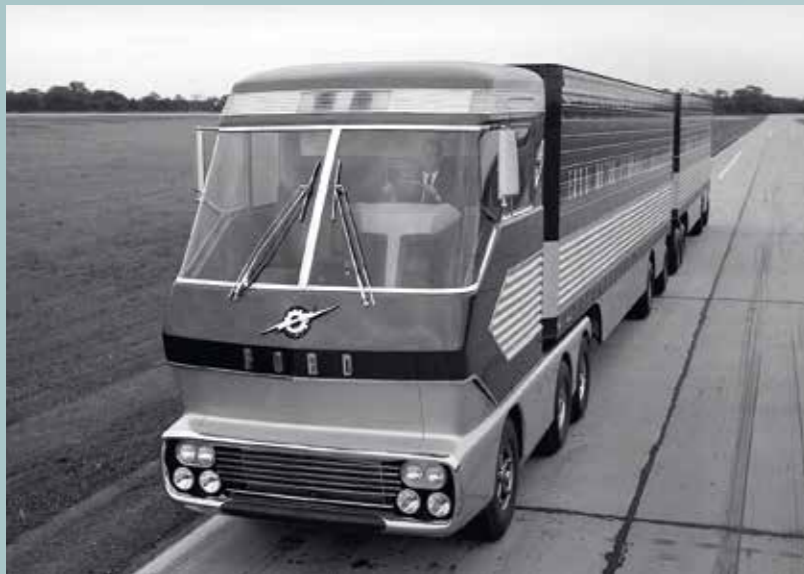
■ Je škoda, že Ford neposkytl více barevných snímků, na nichž by vynikla elegantní kombinace červeného exteriéru a leštěného kovu. Stříbřitý odstín patil za moderní a luxusní