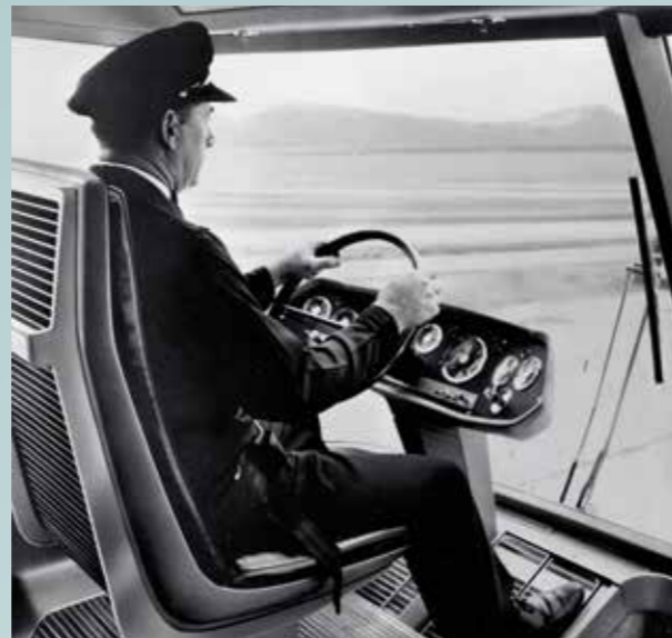
■ Řidič se během jízdy ničím nerozptyluje, řazení převzala automatika Allison. Jen se nemůžeme ubránit otázce, co by se stalo v okamžiku nehody nebo nárazu kamene, vymrštěného koly kolemjedoucího trucku...