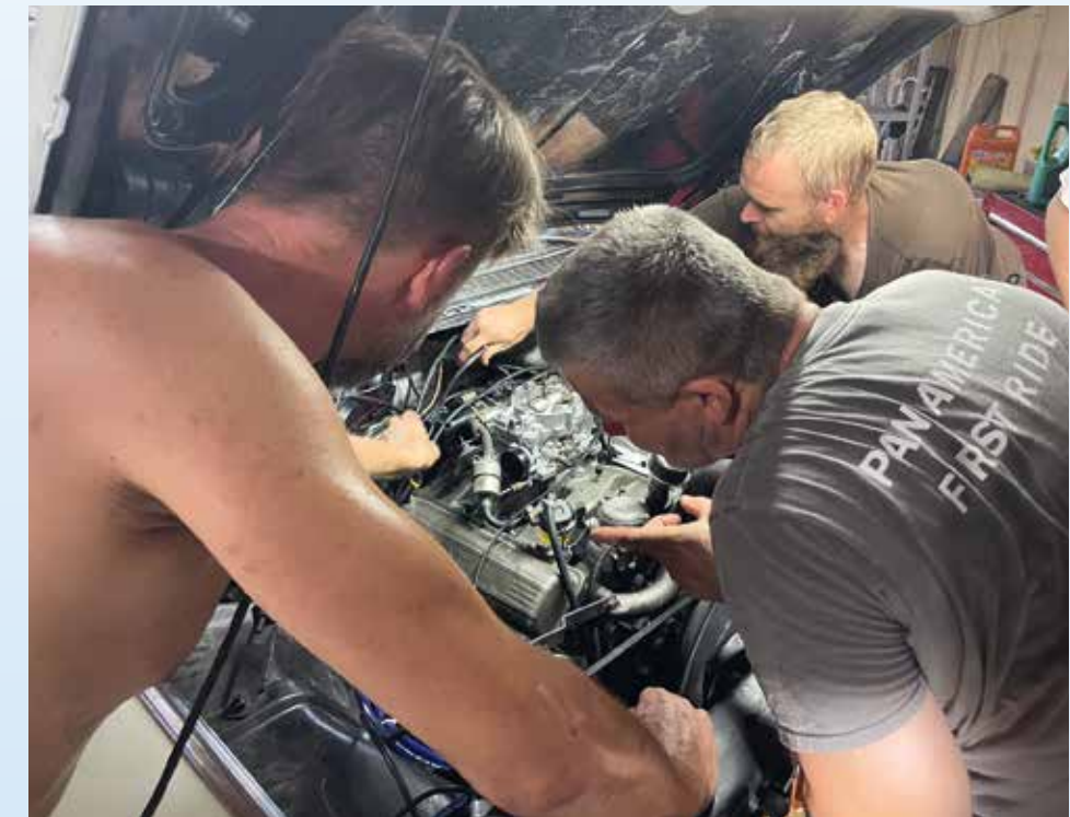
Motor v Convertible je po kompletní GO. Externí mechanik nastavil zapalování a nám se už druhý den nedaří motor nastartovat. Atmosféra houstne a vkrádají se první vážné pochybnosti

Darek na ně později udělal a pryč s ní jednou objeli blok. Může to být těsnění pod hlavou nebo prasklá hlava, nic z toho ale už teď asi nevyřešíme za jeden až dva dny. Zlost se v nás střídala s lítostí, ale ani jeden stav by nám k ničemu nepomohl, a tak jsme se soustředili na práci. Makali jsme na bílém kabriu, které se nám podařilo připravit k prvnímu nastartování. Jeden jejich mechoš mezitím dva dny vyráběl ulomenou trubičku pro měrku motorového oleje a druhý externí mechanik zase podle videí z YouTube na svém iPhone nastavil zapalování. Bože! Nicméně nastartovat motor se nám opravdu povedlo, ale jen na pár vteřin. Poté z nepochopitelných důvodů tuh-