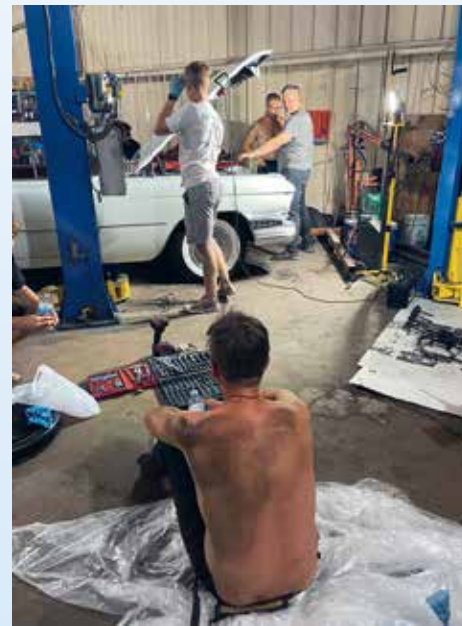
Do našeho usilovného počínání se začínají vkrádat pochybnosti. Motorem v Convertible už nejde otočit ani metrovou tyčí. Únava sílí a nálada se zhoršuje