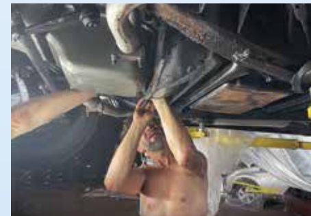
Problémy se startérem má i Convertible. Když ale nepomáhá ani druhá výměna startéru za nový, je jasné, že chyba bude někde jinde. Pořád ještě věříme, že do dvou dnů vyrazíme...

jme jezdili ze Sarasoty do Clearwateru a dodělávali to, co za více než rok tamní servisáci „nestihli“. Červené kupé mělo jen problémy se startérem a nešly mu stěrače. Stříbrná Seville neblíkala. Obě auta jsme projeli a u obou došel krátce po vyjetí na ulici benzín, což rozhodně není dobrá vizitka servisu, který dostal samozřejmě za všechny úkony královsky zapláceno. Co bylo ale horší, že Seville po ujetí pár mil vařila. I po odstranění termostatu se motor hřál a po pár milích vařil tak, že polovina vody vždy vyletěla ven. Mechanici dostali před rokem za úkol s ní najet aspoň 100 mil, prověřit její stav a zjistit tak, jestli je schopná dojet do Kalifornie. Nic z toho neudělali!