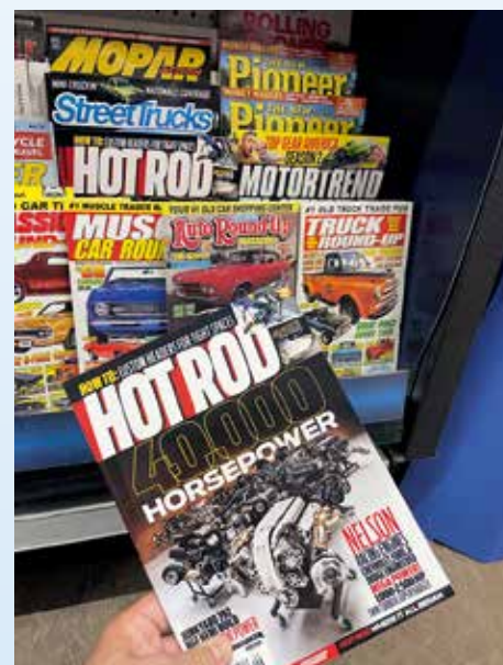
Profesní deformace: vždy a všude prohlížet displaye s motoristickými časopisy. V US je tahle „úchyška“ nejpříjemnější – Hot Rod a Motortrend najdete všude!