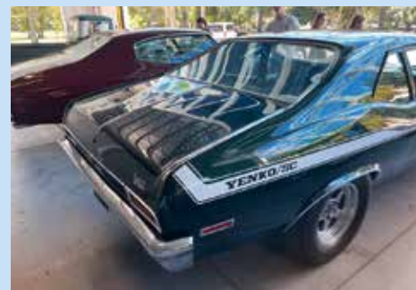
Když přijedete po čtyřech letech do Ameriky, chcete co nejdřív vidět pořádná auta. Zastávka ve Skyway Classics v Bradentonu byla povinností