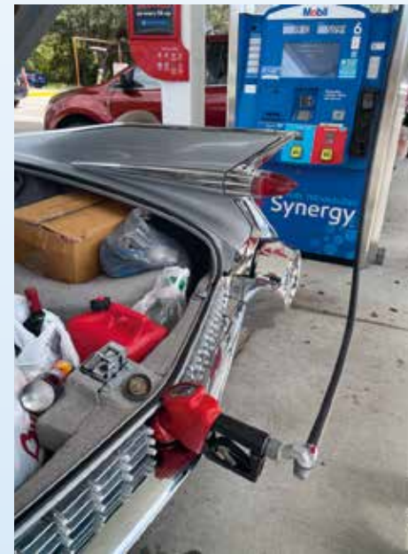
Tenhle každodenní rituál bysme našim čtyřkolovým kamarádům rádi dopřáli. Zatím to ale vypadá, že s námi na západ nepojedou