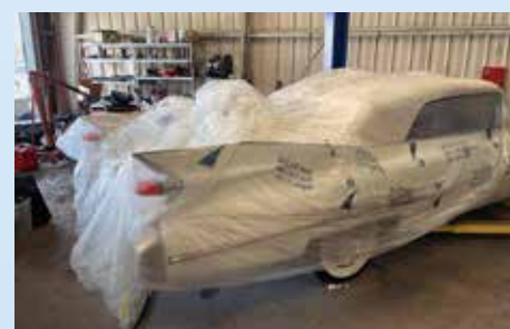
První pohled na náš Cadillac Convertible 1959 po příjezdu do servisu v Clearwateru. Pod igelítem na nás čeká několik nepříjemných překvapení

ale opravdu velký problém, takže plán vypadal tak, že když se Seville nikde neobjeví, koupí pár týdnů před cestou třeba běžný 4-door flat top nebo „šestiokno“. Téměř nemožné se však stalo skutečností! V březnu 2021 se ve Scottsdale v Arizoně objevila Seville a Darkovi se podařilo jí získat. Měli jsme obrovskou radost! Tři padesátdevítky byl základ, na kterém jsme chtěli dále stavět. Do naší 59 výpravy se mohl přidat kdokoliv z kamarádů či známých, ale