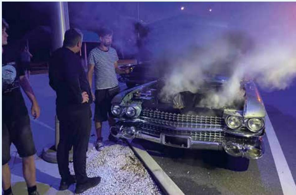
První projížďka se Seville ukázala na velký problém. Motor se masivně přehřívá a po pěti milích vaří. Nepomáhá vyjmouti termostatu ani přidavný ventilátor. Mechanici přiznávají, že nesplnili naši prosbu, aby s autem najeli aspoň 100 mil a prověřili ho