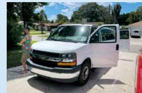
Darek s Markem přivezli z půjčovny šestilitrový Express Extended. Nemá pro nás sice ideální konfiguraci sedadel (je pro 12 osob a my potřebujeme verzi pro 9), ale zkusíme se do něj s kufry vejít