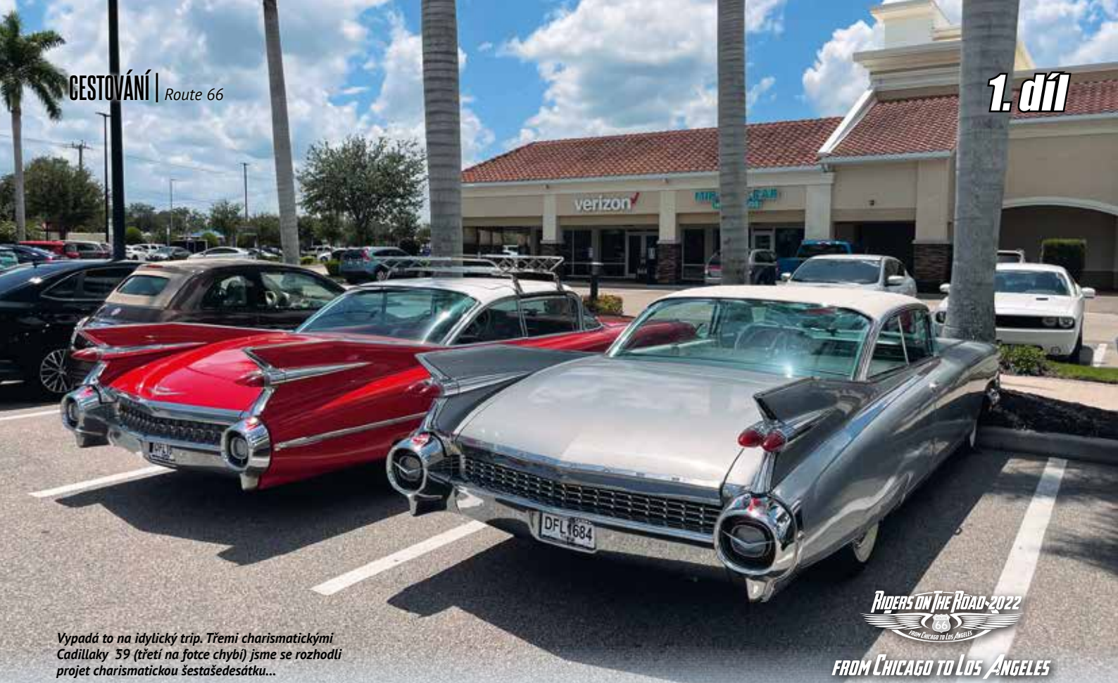
Vypadá to na idylický trip. Třetí charismatičtími Cadillaky 59 (třetí na fotce chybí) jsme se rozhodli projet charismatičtími šestašedesátku...

RIDERS ON THE ROAD-2022 FROM CHICAGO TO LOS ANGELES