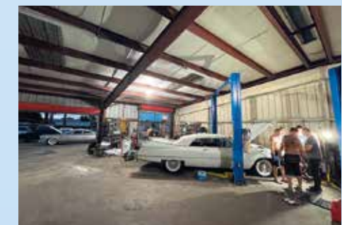
Na autech pracujeme každý den dlouho do noci. Zapojili se i Darkovi kluci Vítek s Kubou. Bílý Convertible má zatím nejvíc nedostatků. Motor naskočil na pár vteřin a poté zatusnul