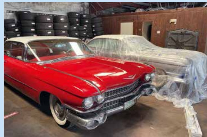
Dvě zbývající padesátdevítky: červené Coupe a stříbrná Seville. Ani jedna není schopná okamžitě vyrazit na cestu. Čeká nás několik dní oprav a ladění

ale opravdu velký problém, takže plán vypadal tak, že když se Seville nikde neobjeví, koupí pár týdnů před cestou třeba běžný 4-door flat top nebo „šestiokno“. Téměř nemožné se však stalo skutečností! V březnu 2021 se ve Scottsdale v Arizoně objevila Seville a Darkovi se podařilo jí získat. Měli jsme obrovskou radost! Tři padesátdevítky byl základ, na kterém jsme chtěli dále stavět. Do naší 59 výpravy se mohl přidat kdokoliv z kamarádů či známých, ale