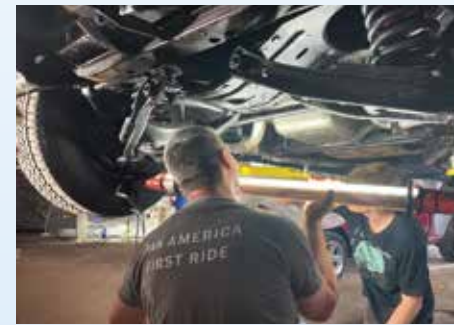
Zjišťujeme, že servis Cadillaců neproběhl, tak jak jsme si mysleli. Před dlouhou cestou je potřeba zkontrolovat všechny důležité součástky včetně náprav a brzd