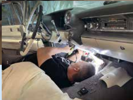
Čtyřdenním útočištěm pro naše auta byla plechová hala v servisu, kde bylo už dopoledne 40 stupňů. K dispozici jsme měli jeden zvedák, dva ventilátory a nářadí na úrovni amatérského garážisty