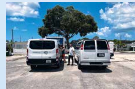
Porovnávání prostoru se šestiválcovým Transitem na popud některých účastníků „zájezdu“. Sedadla jsou sice lepší, ale prozatím zůstáváme věrni Expressu!

věrnými čtenáři obeznámenými s naší cestou jsem se nechal přesvědčit, že by to byla škoda