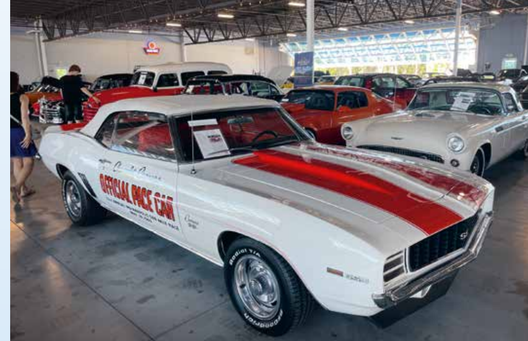
Sběratelský Chevrolet Camaro Indy 500 Pace Car Convertible 1969 může být váš za 79.997 dolarů. Před 54 lety jste si ho mohli objednat pod kódem RPO Z11 s touto speciální kapotou ZL2 a továrním small-blockem 350 cu.i. Camaro stojí na Rally kolech ZJ7 a na karosérii má autentické pruhy ve stylu Hugger Orange Z28. Skyway Classics garantuje vlastnictví vozu prvním majitelem