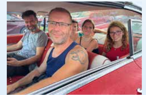
Červené kupé už najíždí první míle. Jedeme nakupovat do Burlingtonu, at máme co na sebe...