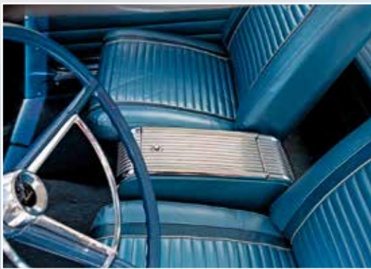
Cestující na předních dělených sedadlech mají k dispozici středovou konzoli