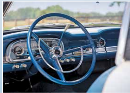
Podoba přístrojového štítu vychází z Fordu Galaxie

vybavený buď přední sedadlovou lavicí nebo „sportovními“ samostatnými sedadly. Výbavu doplňovalo elektrické ovládání látkové střechy. Convertible v základu měl pod kapotou šestiválec 170 cu.i., jeho cena začínala na 2.470 USD, takže dražší v celé modelové řadě Falconu byl už jen kombík Squire Wagon. Z cel-