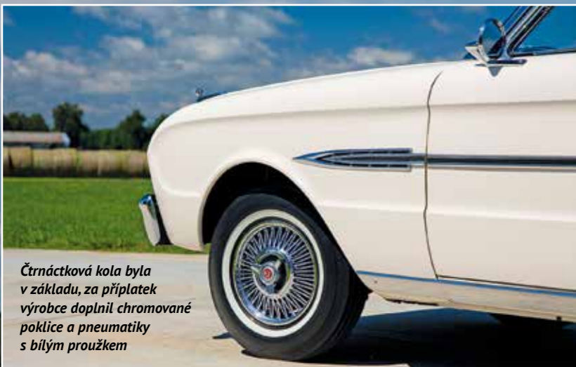
Čtrnáctková kola byla v základu, za příplatek výrobce doplnil chromované poklice a pneumatiky s bílým proužkem