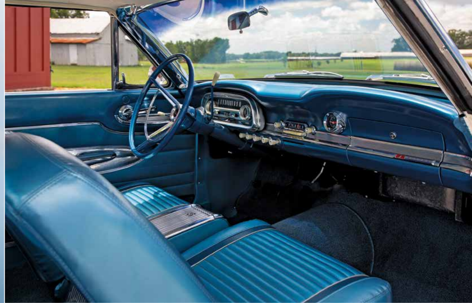
Zákazník si mohl vybrat z pěti barev látkového či vinylového čalounění, ladicího s odstínem karosérie. Na snímcích „Corinthian White“ a modrý vinylový interiér