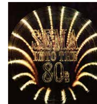
Osmdesátá léta představovala dobu přelomu, protože aftermarketový prodej zasáhl nové oblasti ležící stranou původního trhu dílů pro závodní činnost