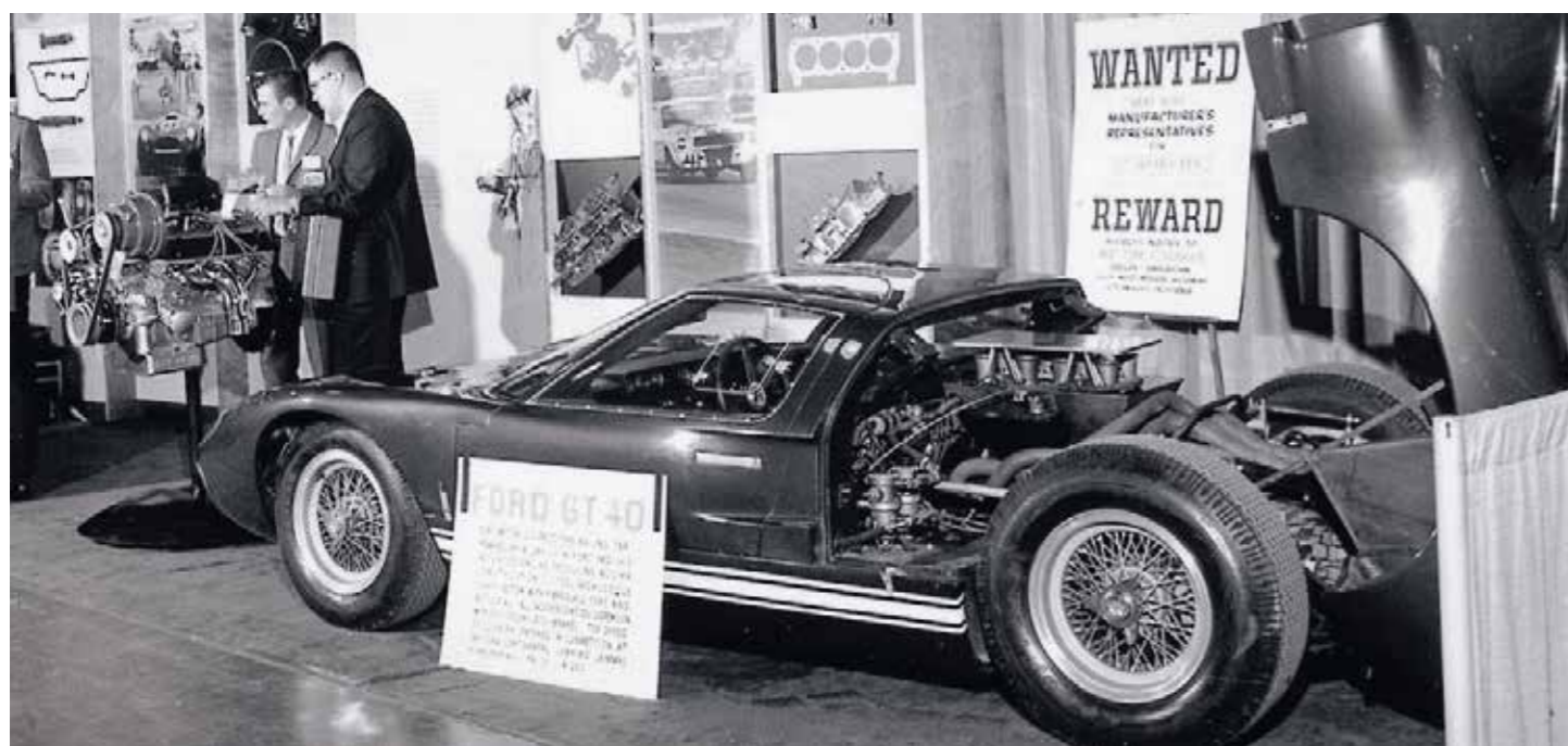
Shelby American představil supersportovní GT40 a naleštěný small-block Ford 289 cu.i. doplněný kompresorem Paxton a hliníkovou vanou. Tou dobou Carroll Shelby urgentně sháněl prodejce svých aut a ostatních výrobků

John Thawley, Hot Rod Magazine, březen 1968