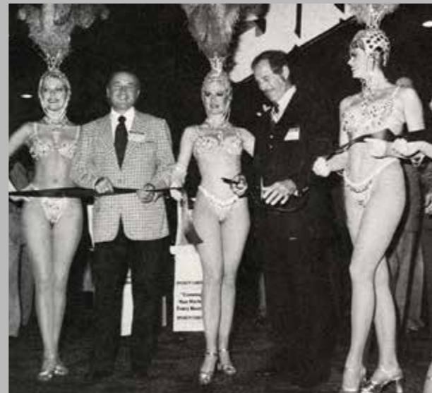
Viva Las Vegas! Metropol hazardních her přivítala tuningový veletrh v roce 1977 slavnostním zahajovacím ceremoniálem, krásné showgirls na sebe strhly všechnu pozornost