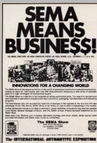
SEMA znamená obchod! Slavnostního banketu v roce 1981 se zúčastnili Beach Boys, hlavním řečníkem v Den inovací byl prezident Buicku Lloyd Reuss. Hovořil o výkonech věšestek Buick...

Tady se driftovat nebude! V roce 1977 se ještě nějaké to místečko našlo, ale v pozdějších letech byly veškeré okolní zpevněné plochy beznadějně plné!