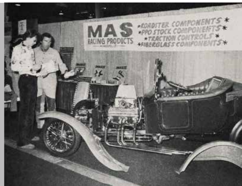
Do Anaheimu se sjížděli výrobci z celých Států včetně „Minnesota Auto Specialties“. T-Bucket z roku 1923 ukazuje expozici firmy, která zavřela své brány v roce 2009