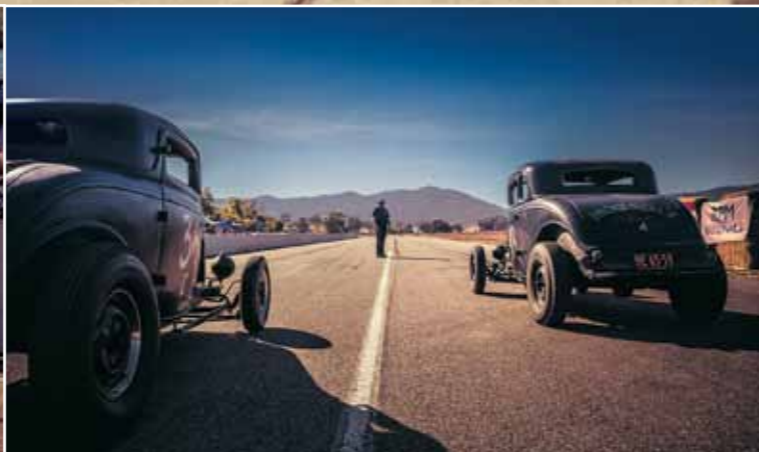
Účastníci závodu vymáčknou z motorů koně až do posledního, jen aby se vidělo, v čí garáži vznikl nejrychlejší stroj