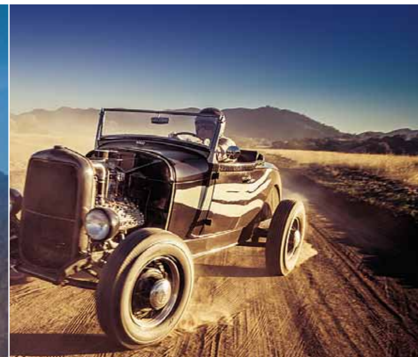
Návrat z dragstripu probíhá po prашných stezkách pro dobytek na opačné straně ranveje. Stejně tak by to řešili organizátoři před 80 lety!