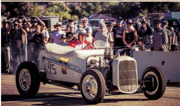
Závod se dělí do třech kategorií a každá je vypsaná zvlášť pro čtyř- a osmiválce