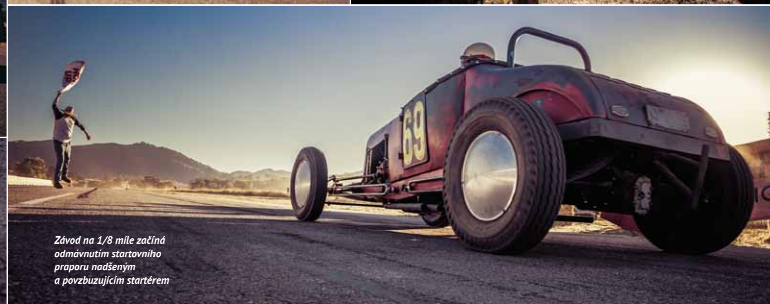
Závod na 1/8 míle začíná odmávnutím startovního praporu nadšeným a povzbuzujícím startérem

V malebné krajině mezi nevysokými svahy kalifornské Santa Margarity se od roku 2017 konají závody s názvem RPM Nationals. Ranč Santa Margarita nedaleko Highway 101 mezi San Luis Obispeem a Atascaderem nabízí účastníkům nejen velké louky pozlacené podzimním sluncem, ale hlavně blízké letiště s asfaltovou ranvejí, která se po dobu akce stává vintage dragstripem.