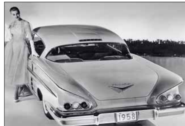
Název „Impala“ se poprvé objevil v roce 1956 u konceptu Chevrolet XP-101 Corvette Impala