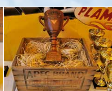
Exkluzivní ručně vyráběný dřevěný pohár Best of Best vyrobil člen klubu Marek Mandík. Děkujeme!