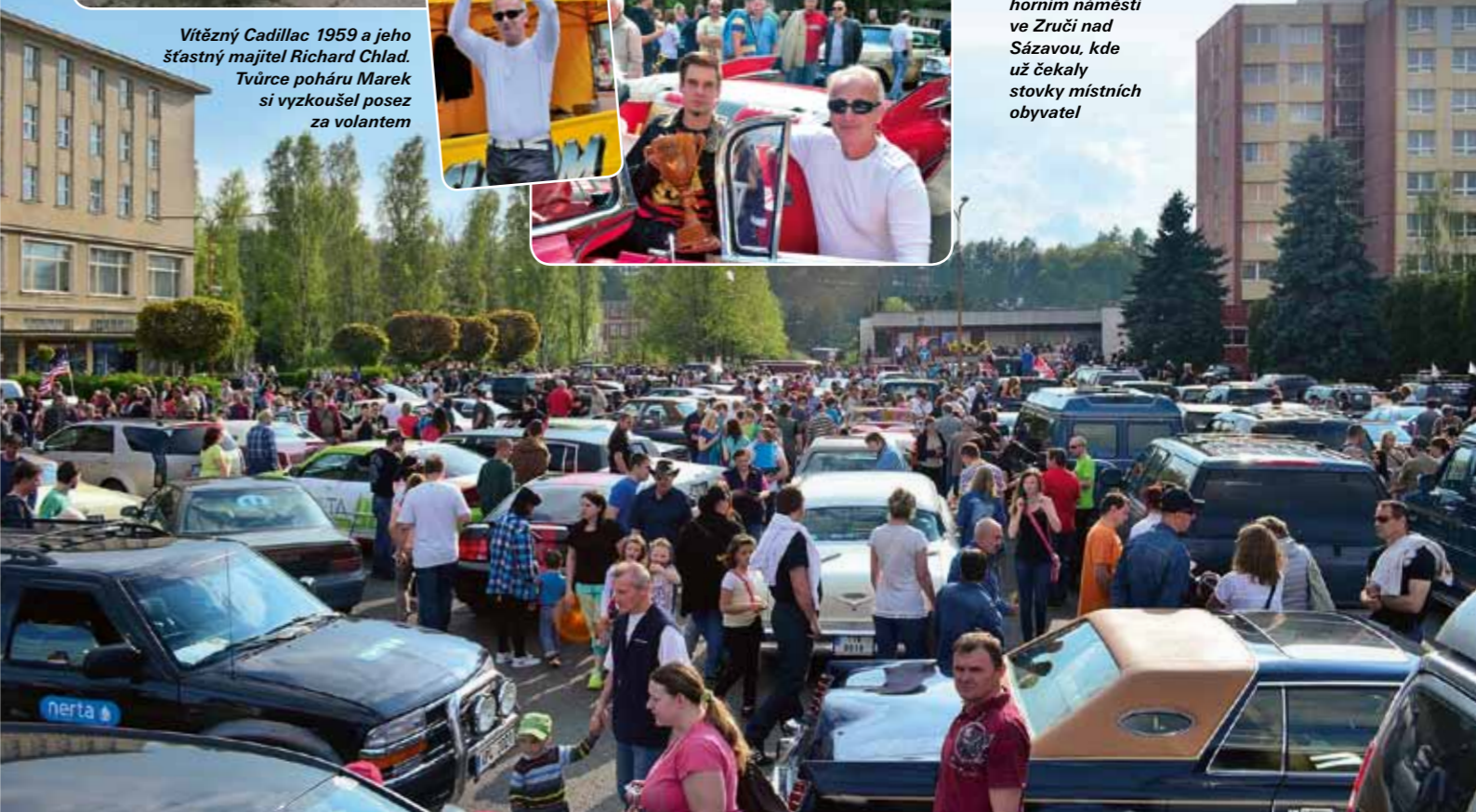
Spanilá jízda končila na horním náměstí ve Zruči nad Sázavou, kde už čekaly stovky místních obyvatel