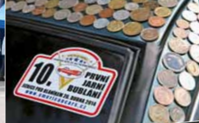
Celých 250 kg mincí spotřeboval majitel na polepení karosérie svého Lincolnu Continental. Tomu se říká „auto za všechny prachy“!