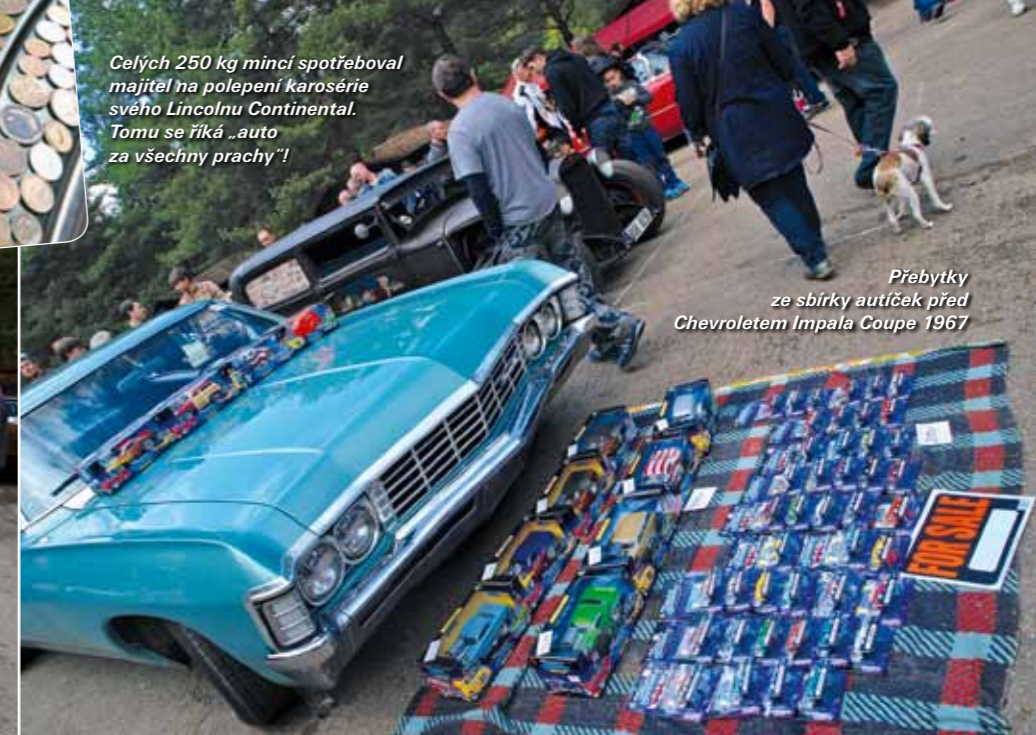
Přebytky ze sbírky autíček před Chevroletem Impala Coupe 1967