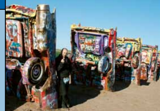
Fuck the fuel economy! Fuck downsizing! FTW!

Modré nebe, zelené pastviny a silný vítr na Texas Panhandle. To je Amerika. Tam je Cadillac Ranch!