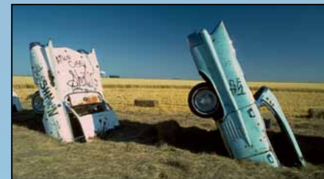
Fotka stejného místa přesně o deset let později, pořízená 21. června 1984 při párty k 10. výročí. Jules Backus, autor fotografie, zemřel v roce 1998. Byl to velmi štedrý člověk, který rozdal většinu svého díla. Pracoval na fotografickém projektu o graffiti v Paříži, kde náhle onemocněl a do roka zemřel

Stanley stál u zrodu dalších uměleckých projektů v Texasu, např. Dynamit Museum - Road Does Not End. Jednu ze 17.000 instalovaných zna-