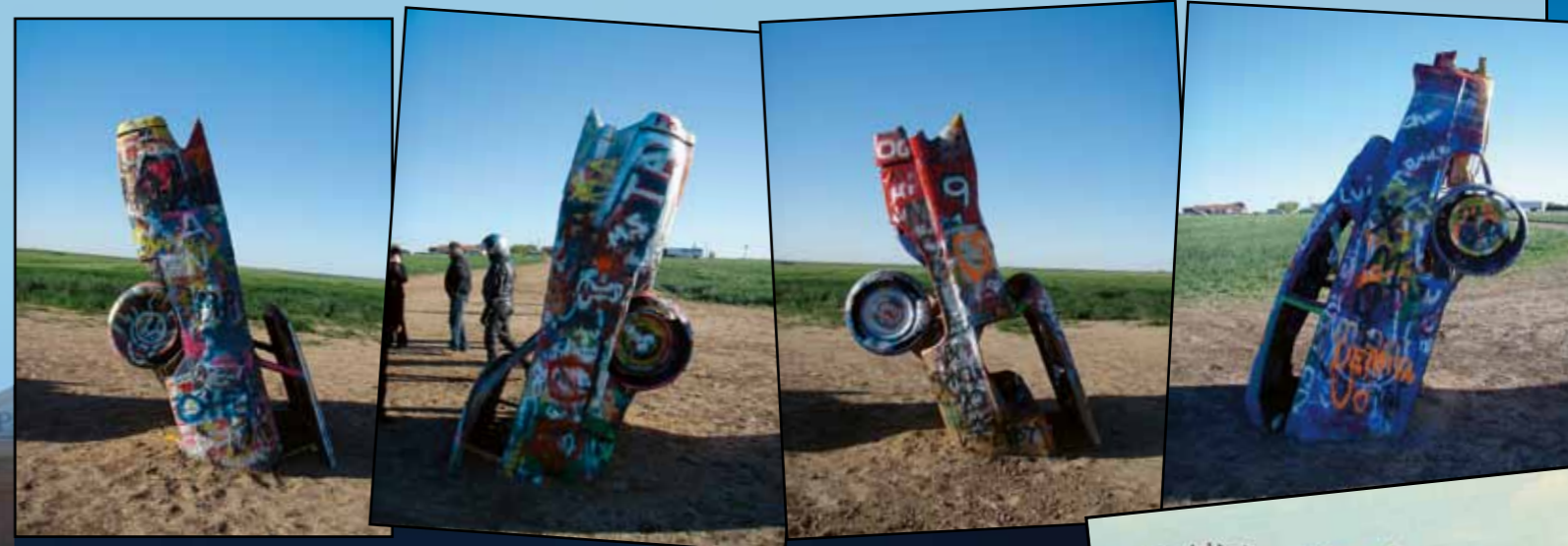
Cadillac Ranch se nachází kousek od bodu, ze kterého je stejně daleko do L.A. jako do Chicaga. Dvou milníků na US RT 66