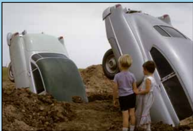
Stanleyho děti jsou výstavbou Cadillac Ranch evidentně fascinovány - 17. června 1974, Amarillo, Texas

Cadillac Ranch je nejznámější a nejfotografovanější atrakcí na U. S. Route 66