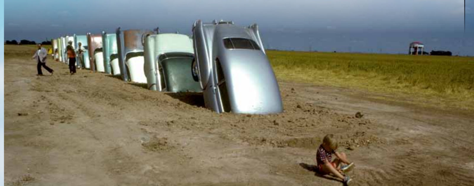
Krátká pauza po dokončení Cadillac Ranch - 21. června 1974, Amarillo, Texas