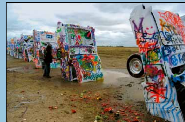
Návštěvník využívá možnosti zanechat svůj vzkaz na jednom z Cadillaců den po oslavách 30. výročí otevření Cadillac Ranch – 22. června 2004, Amarillo, Texas