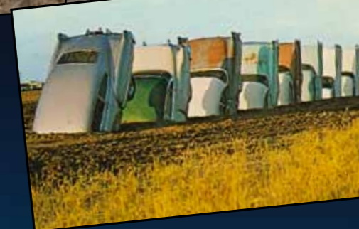
Za 40 let se Marchovo dílo výrazně změnilo...