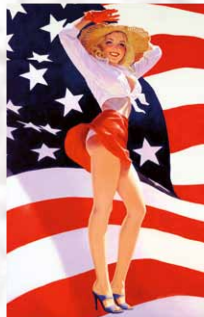
Tak tenhle obrázek je snem každého řidiče s volným sedadlem spolujezdce: „Blonde White and Blue“