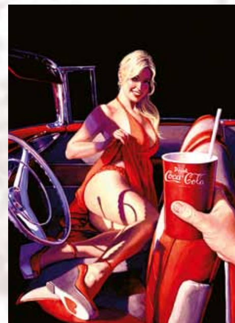
„Things Go Better With...“