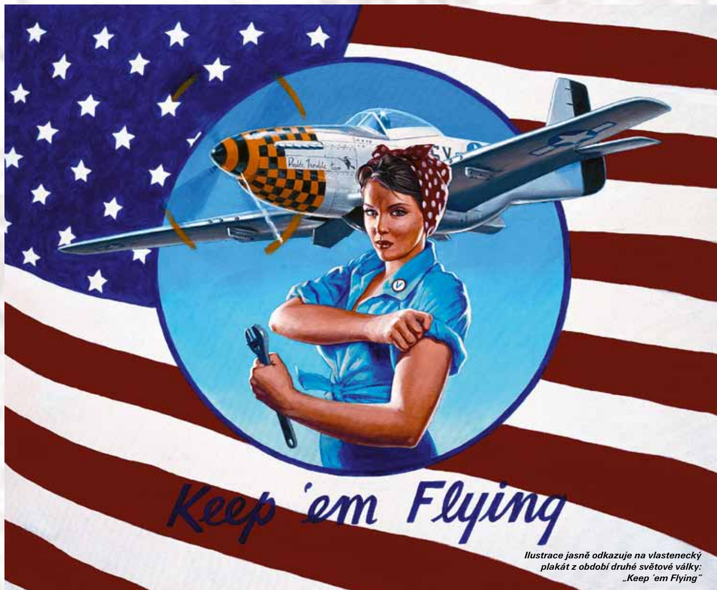
Ilustrace jasně odkazuje na vlastenecký plakát z období druhé světové války: „Keep 'em Flying“