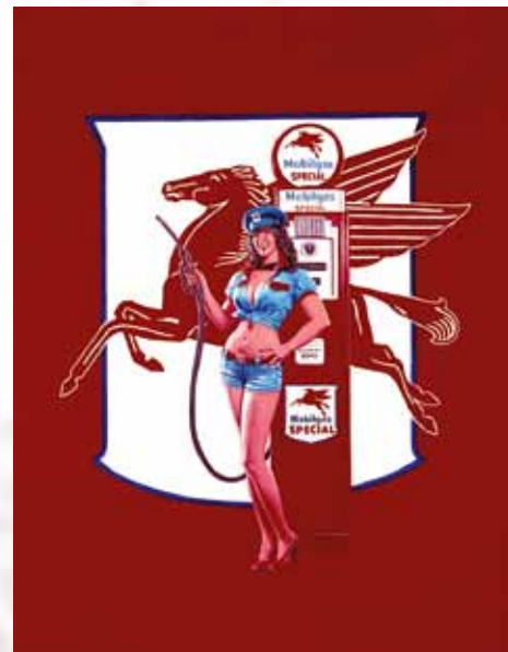
Takto příjemná obsluha by vždy tankovala jen do plna: „Fill Her Up“