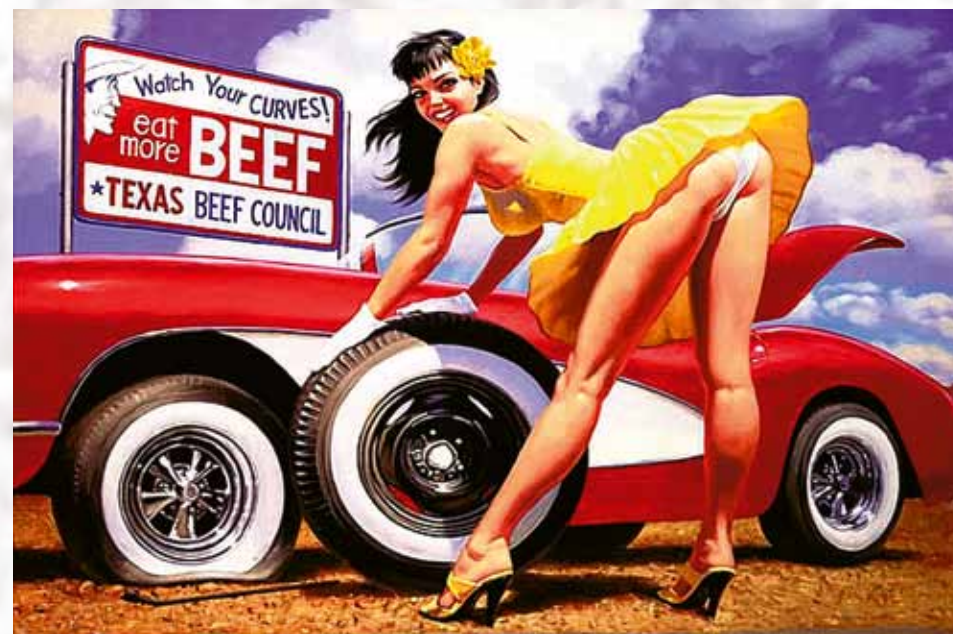
Modelky mají opravdu nelehký úkol – musí se usmívat i při výměně kola: „The Yellow Rose of Texas“