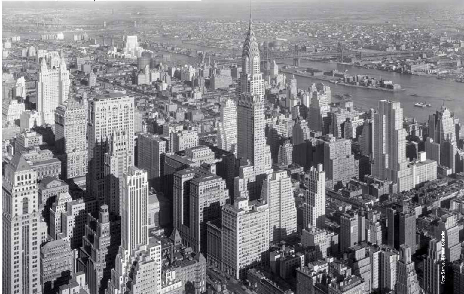
Chrysler Building, New York City 1932