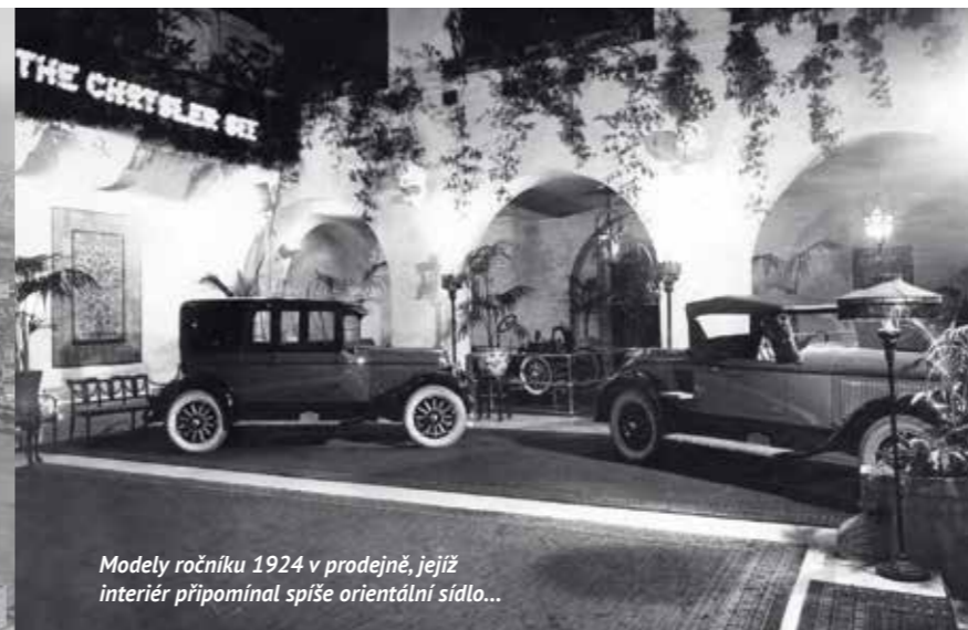
Modely ročníku 1924 v prodejně, jejíž interiér připomínal spíše orientální sídlo...