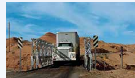
Kdo s koho? Jaguar i Challenger se řítí bok po boku, když se najednou před nimi objeví jednosměrný most s projíždějícím skříňovým Dodgem. Být to italská komedie, jdou závodníci každý na jednu stranu