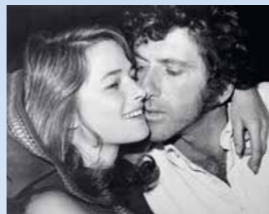
Krásná Charlotte Rampling měla roli stopařky, ale produkce nechala všechny natočené záběry odstranit – v každé zemi, kde se snímek promítal, s výjimkou Velké Británie. Není divu, je to Angličanka