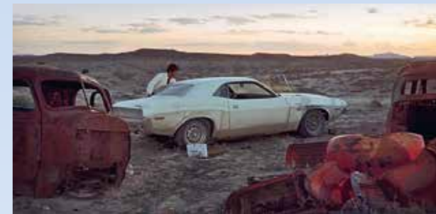
Mlčenlivé postání vedle vraků – co tím chce autor scénáře divákům sdělit? Loučí se snad Kowalski prostřednictvím zmuchlaného kovu s celým světem? Ví, že nepřežije? Nechce přežít? Tohle je hodně emotivní moment