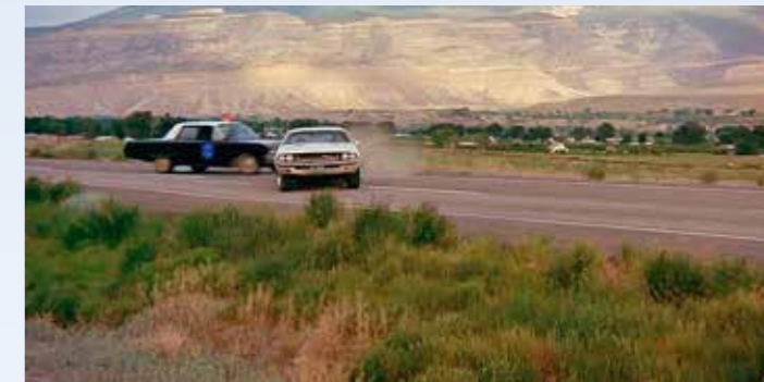
Tady to bylo „vo fous“ – pronásledovaný zase udělal něco zcela neočekávaného a divák málem zaslechl rachot bortících se plechů. Výsledkem je modrý kouř od zablokovaných pneumatik a jedna Polara pod silnici