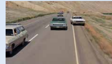
Řidič zelené Impaly provedl něco, zač se v ředlu dává pár facek. Kowalského málem „zakotvil“ na fleku, ten jen díky závodnickým reflexům stačil uhnout vlevo. Všimněte si i krásného kombiku Chevy