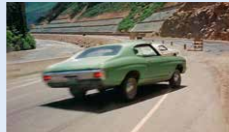
Krásný nový Chevelle kupé zajímavého odstínu (nemusí být všechny červené, že ne?) z hrozní srážky se spěchajícím Challengerem vybrusil jen taktak. Chevrolet se ve filmu objeví ještě jednou