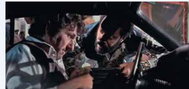
Předmětem ztřeštěné sázky je sobotní telefonát ze San Franciska: pokud vyhraje Kowalski, má celou dávku prášků gratis, pokud prohraje, zaplatí dvojnásobek ceny. Přitom má Challenger odevzdat teprve v pondělí