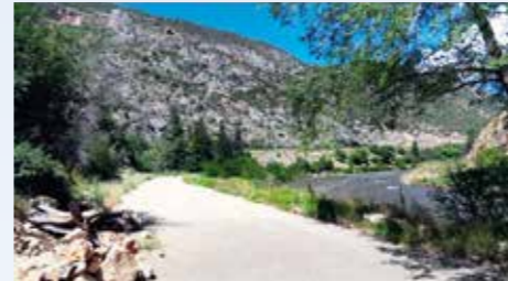
Někdejší kvalitní široká silnice se po stavbě estakády změnila ve slepou cestu. Nádherná krajina na březích řeky Colorado u No Name, vzadu za policisty můžete vidět plně parkoviště aut filmového štábu