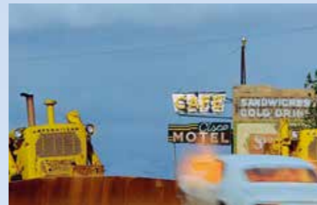
OMFG, this is Camaro, voláme podruhé! Nebohý Chevrolet, který musel vyměnit motor a skříň za výbušniny, ze záhadného důvodu vzlétá a „naráží“ do radlic, i když evidentně vybuchne už předtím...