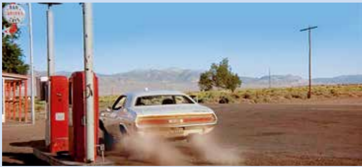
Přišla chvíle natankovat, Kowalski zajel k anonymní malé benzínce po cestě. My ale víme, že se nacházela v nevadském Carvers, malém hnědém založeném bratry Geraldem a Jeanem Carversovými až v roce 1939