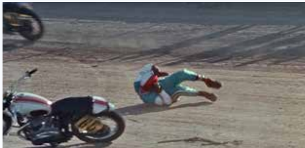
Dějové roviny, osvětlující některé momenty ze života Kowalského, se prolínají celým filmem, ale jsou oddělené tak, aby nemátly. Tady může divák sledovat pád hlavního hrdiny na ploché dráze. Maléry se mu nevyhýbaly...