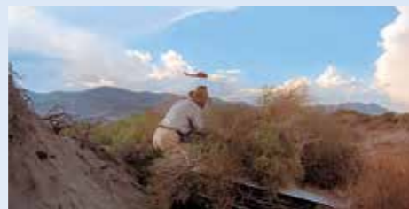
Nejen ze silnice, ale i ze vzduchu: policie nasadila hlídkové helikoptéry, takže by prchající neměl nejmenší šanci – pokud by mu neporadil starý praktik, jak zamaskovat auto, aby bylo neviditelné