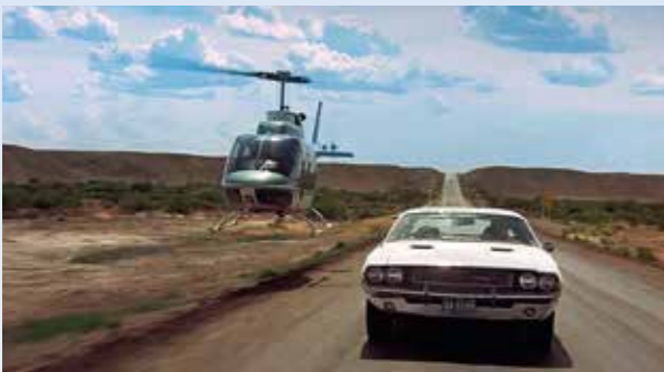
Před chvílí jsme se pohledem kamery ve vzduchu seznámili s autem hlavního hrdiny. Děj tady dělá obrat a ukazuje přípravy na závěr honičky. Záběr se natáčel na státní silnici 128 nedaleko od utažského Ciska