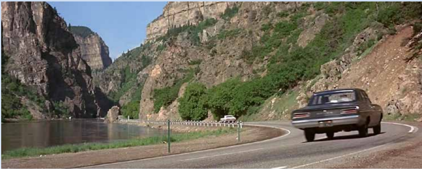
Kowalski jede o dost víc, než předpisových 65 mil. Není divu, že si ho hlídači všimli. Černý Coronet se nám představí na mnoha záběrech včetně proměny do hlídkového vozu. V té době to byl čerstvý model, stejně jako Chally