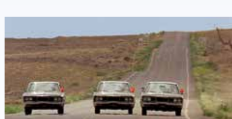
Trojice identických Polar s bočními majáky se tváří stejně nekompromisně jako jejich osádky uvnitř. Uprchlíkovi se zužuje životní prostor a musí jednat buď rychle nebo jednoznačně. Co udělá?