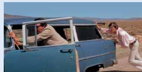
Odpudivá dvojice „novomanželů“, tlačící svůj Chevy '55. Za dobrotu na žebrotu, řekl by Kowalski, když na něj hnusák v růžovém vytáhl zbraň. Ale neřekl nic, dal jim pár ran a vykopal je z auta!