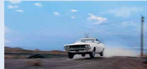
Jede se dál, třebaže do konce filmu i života hlavního hrdiny zbývá už jen pár mil a jeden železniční přejezd, přes který si Challenger parádně zaskákal. Právě pro tyhle účely měly dva vozy zesílené odpružení „heavy duty“