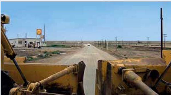
Dobře známá benzínka vykukuje nad radlici Caterpillaru, Kowalski se řítí na plný výkon svého 440 cu.i. Divák, který děj vidí poprvé, může být trochu zmatený, protože neví, jak děj bude gradovat. Ale za moment se dočká...