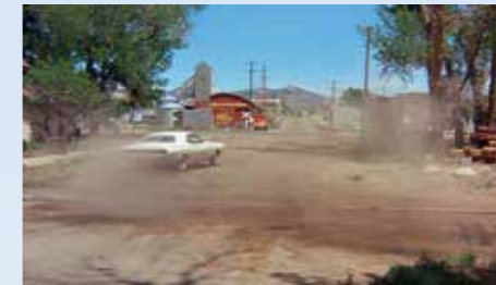
Při průjezdu a klíčování areálem píly a vlečky v coloradském městě Rifle Kowalski Dodge nešetří. Asi nebudeme daleko od pravdy, když řekneme, že i tady dostalo zavěšení „heavy duty“ do těla