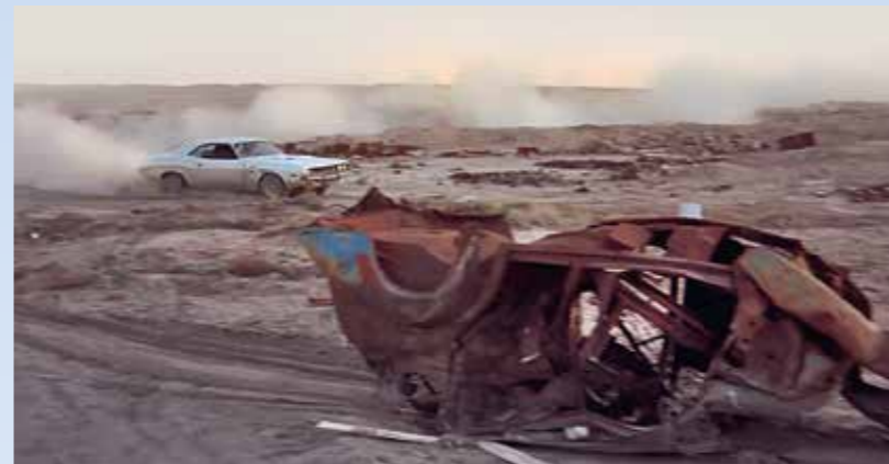
Dobře se podívejte na levou stranu vedle převráceného vraku! Ten vůbec není součástí pouště dlouhé desítky let, jak se nám snímek snaží naznačit. Naopak, je naprosto čerstvě přitažený, jak jasně ukazuje stopa

Kowalski vyjžděl z Denveru (Colorado) a míří do San Franciska. Projíždí tedy ještě Utah a Nevadu. Filmaři použili exteriéry skutečných lokalit. V paměti každému asi nejvíce uvízne Cisco, kde se děj i život Kowalskiho završil. Cisco je tzv. „Město duchů“ v Utahu nedaleko Interstate 70. Dodnes stojí některé budovy účinkující ve filmu. Rozhlasová stanice, odkud vysílal Super Soul, je situována do bývalého hotelu Goldfield v nevadském okrese Esmeralda. Budovu najdete dodnes. První pokus o zastavení Kowalskiho motohlídkami se odehrává v pozoruhodné scénérii coloradského Glenwood Spring nedaleko soutoku řek Colorado a Roaring