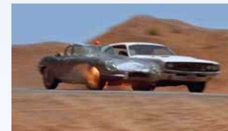
Sakra, co nám to u Jagase bouchlo? Záblesk, plamen – a o sekundu později kamera ukáže zběsile se točící kolo s drátovým výpletem bez vzduchu. Jaguar končí a dopadem do bahna odchází z jeviště!