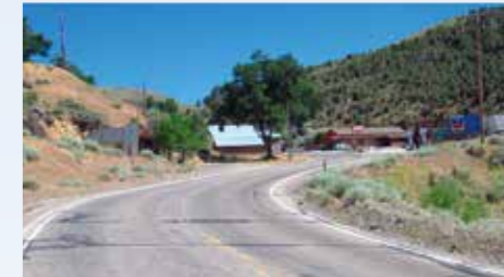
Některé jiné exteriéry se za padesát let zase tak moc nezměnily, například výpadovka Lincoln Highway (US-50) z nevadského Austinu, lemovaná benzínkami. Chevron tam je dodnes, jen ty ameriky zmizely

Text: J.F.K.