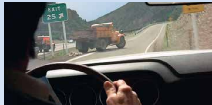
Kolem nákladního Internationalu (je jich tam víc) se Kowalski jen mihne. Trucky pracují na stavbě – a diváka možná napadne, jestli se ten průjezd stavbou nějak promítne do děje. To si pište, že se promítne – a jak!