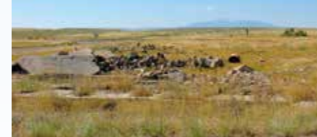
V pozadí za buldozerem je vidět motel v Cisku. Z prosklené stavby zbyly dnes rozvaliny základů a rozházené zbytky zdí. Podle statistiky žili v roce 2020 v Cisku 4 stáří obyvatelé. Časy se mění...