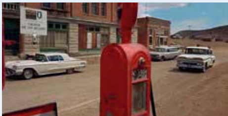
Pár nádherných záběrů ospalého a Bohem zapomenutého městečka, do nějž se proměnil nevadský Goldfield, posázený doslova automobilovými drahokamy. Jedním z nich je i GMC ročníku 1960, plný rváčů