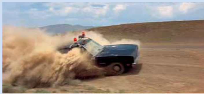
Hlídkáři, trávící čas postáváním u zánovního Plymouthu klábosením a opalováním, se na pokyn z centrály rozjedou za podezřelým, ale potkají jej v protisměru. Teda, ještěže mají v US tak ohromné plochy kolem krajnic...

nechá. Na okraji Ciska se vedle žlutých Caterpillarů shromažďují televizní štáby, novináři a čumilové. Všichni jsou v roli supů, aniž by o tom věděli. A K-