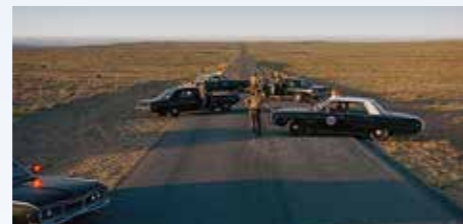
Barikáda z pěti silných Moparů (které určitě účinkovaly i v předchozím ději), a tou ani Challenger neprojde. Je to poslední šance, jak odchytit Kowalskiho, než se do věci vloží stát Kalifornie