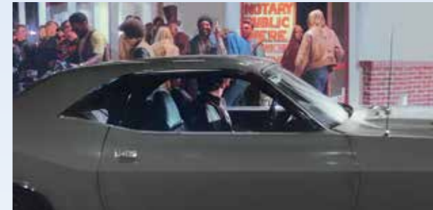
Děj se mezitím smyčkou vrátil na začátek a my jsme v Denveru. Je pátek kolem půlnoci, Kowalski před chvílí odevzdal přivezený Imperial a teď za volantem Challengeru shání fet, aby vydržel řídit až do San Franciska