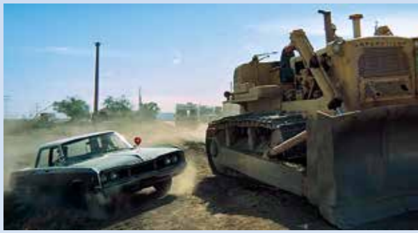
Jakmile se oba Caterpillary dostaly do výchozí pozice, přijíždějí policejní hlídky – jak jinak než ve výrobcích Chrysleru. Scéna se natáčela jako první, Dodge měnily nálepky policejních sborů podle místa natáčení