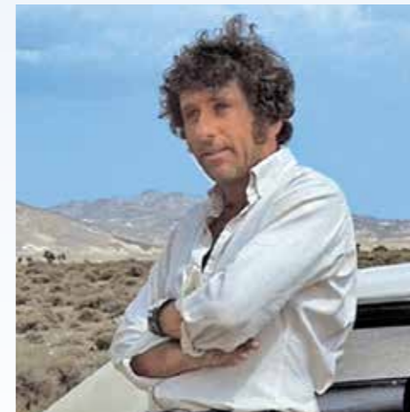
Barry Newman představuje odlišný typ hrdiny, než jsme zvyklí vidat v amerických filmech podobného žánru. Nevyzaňuje chladnokrevnou profesionalitu Steva McQueen, zato má občas lidštější reakce

Text: J.F.K.