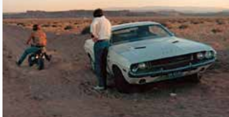
Naprostu neuvěřitelný! To je trik hodný nebožtíka Barnuma! Na druhou stranu se nezdá, že by to ostří hoši zhlitli i s navijákem, a nechali se oblafnout. Motory řvou naplno a orgánové vyrážejí!