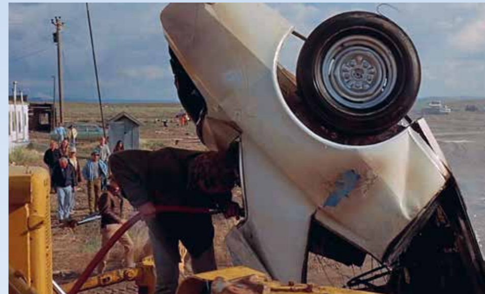
Kalifornie, sobota, deset hodin dopoledne: Camaro je ve své druhé půlce spíše očouzené než zdemolované, pomalu dohasíná, děj končí, mysl diváka ještě uvažuje nad jednáním Kowalskiho. Proč, ptá se...