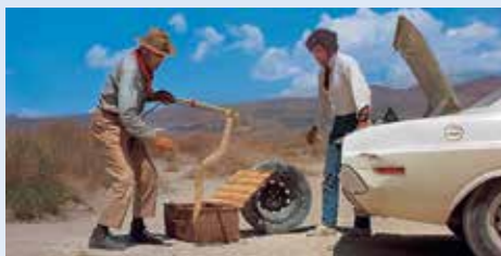
To musela být chuťovka v takovém horku měnit kolo, navíc na tom měkkém povrchu. A hned potom had! No, naštěstí u toho byl pohotový hadák, kterému nedaleko odtud klekl jeho obstarožní pick-up Ford

ní úsměv řidiče, pobavená a trochu i smutná jiskra v jeho očích. Už jen sto yardů, už jen padesát, už jen deset, už jen-----