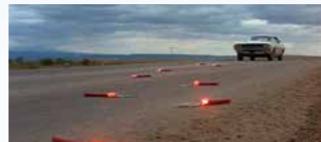
Challenger, projíždějící kolem červených světlků, vidíme nekompromisně jako jejich osádky uvnitř. Uprchlíkovi se zužuje životní prostor a musí jednat buď rychle nebo jednoznačně. Co udělá?