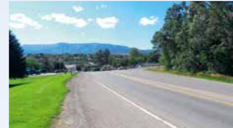
Kowalski se řítí za asistence policie do coloradského města Rifle v okrese Garfield. Město si příští rok připomene 140 let od založení, jeho podoba se od natáčení Vanishing Point zásadně proměnila