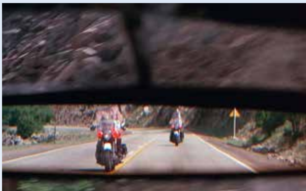
První kontakt s policií se odehrál na silnici podél řeky Colorado. Dnes je z ní pouhá slepá cesta, doprava je odkloněná na vedlejší dálnici po ocelovém mostě přes Grizzly Creek. Názvy jako z westernů, co říkáte? ©