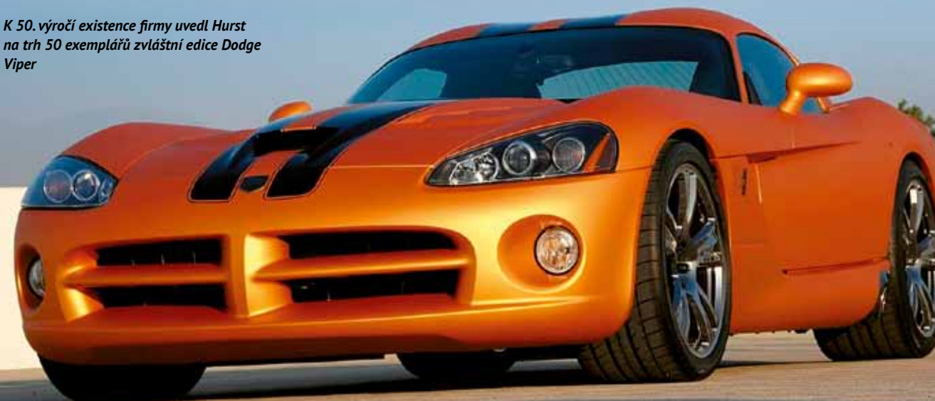
K 50. výročí existence firmy uvedl Hurst na trh 50 exemplářů zvláštní edice Dodge Viper