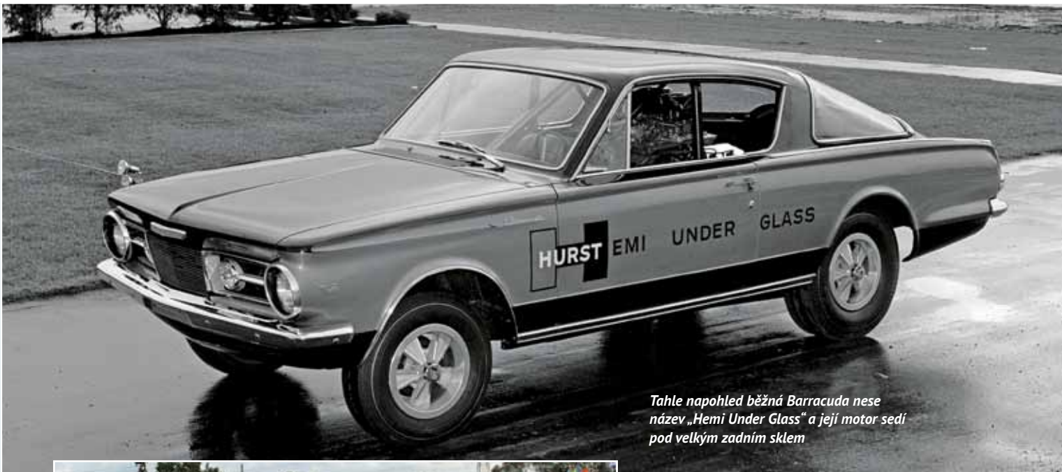
Tahle napohled běžná Barracuda nese název „Hemi Under Glass“ a její motor sedí pod velkým zadním sklem