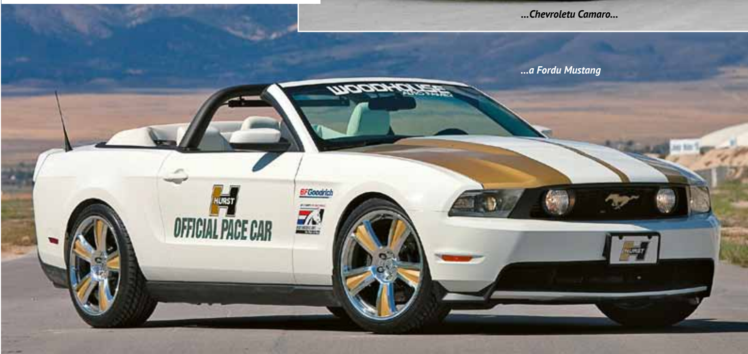
...a Fordu Mustang