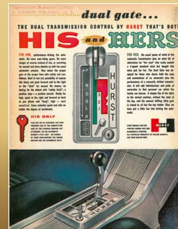
Hurst Dual Gate aneb „His'n'Her“ – dvě kulisy pro odlišný mužský a ženský způsob řízení

Když už jsme zmínili proslavenou rukojeť tvaru T: ta se dala jednoduše našroubovat na závit. Další populární výrobek, „Pistol Grip“, měl dřevěné části rukojeti po obou stranách páky. Mimo to je George Hurst i objevitelem „Dual Gate“ či chcete-li „His'n'Her Shifter“: tohle zařízení využívá jednoduchého principu páky pro dvě kulisy – pro ženy a muže. Hlavní část se nacházela vlevo a měla obvyklou kulisu P-R-N-D-L, kdy řidič nastavil páku do polohy „Drive“ a nechal převodovku pracovat. Pravá