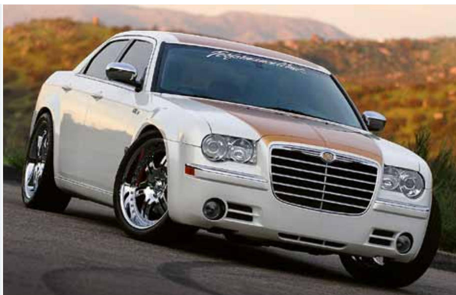
V současnosti vznikají různé limitované edice s označením „Hurst“ na bázi Chrysleru 300...

V roce 1968 vstupuje Hurst na burzu cenných papírů, dva roky poté byl převzatý společností Sunbeam Products, výrobcem kuchyňských přístrojů. Tím se Hurst dostal z výlučně automotivní oblasti i k jiným výrobkům. Princip jeho „Jaws of Life“ je známý především hasičům a záchranářům – jedná se o světově proslulý hydraulický nástroj, který zachránil už tisíce životů. Začátkem 70. let pomáhal Hurst vybavit speciální záchranářský AMC Gremlin „Emergency Medical Service“, který se dostal i do Evropy a představil