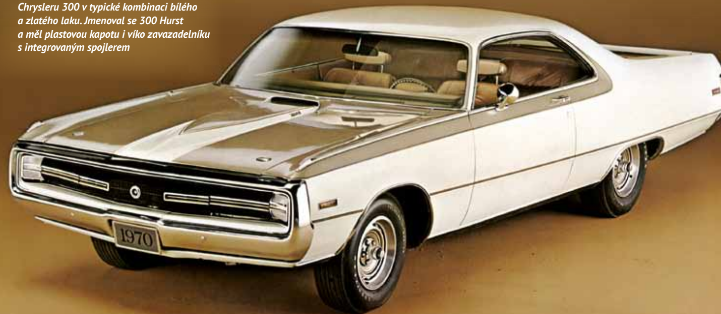
V roce 1970 přišel na trh zvláštní model Chrysleru 300 v typické kombinaci bílého a zlatého laku. Jmenoval se 300 Hurst a měl plastovou kapotu i víko zavazadelníku s integrovaným spojlerem