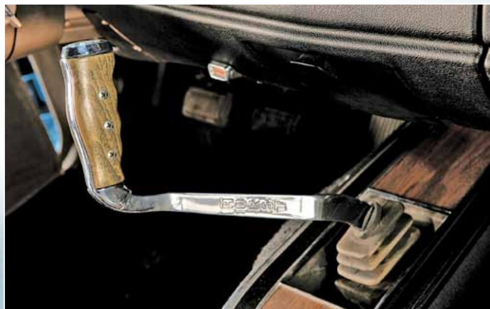
Hurst Shiftter najdete v mnoha výkonných amerických – v základu, za příplatek nebo jako dodatečně montované příslušenství