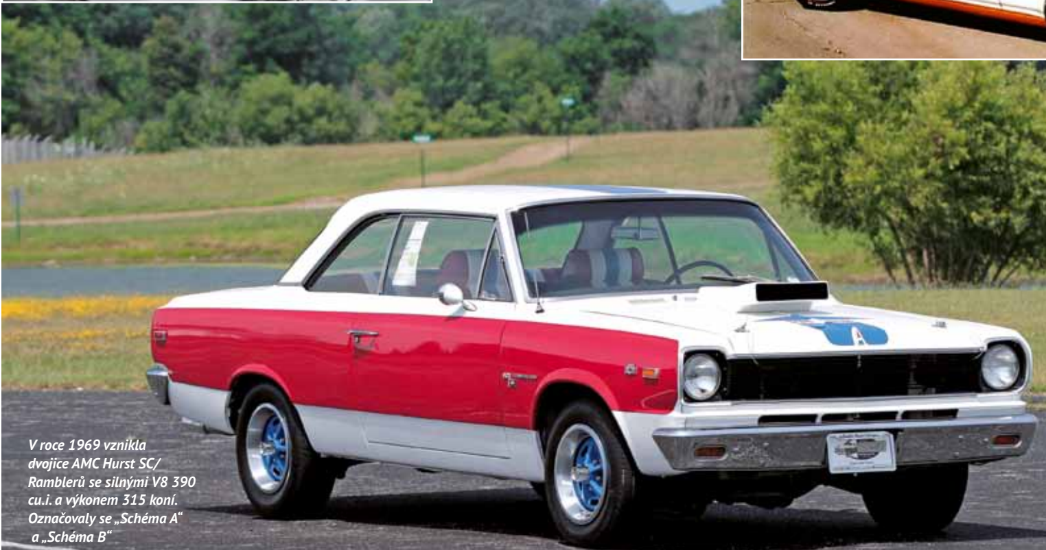
V roce 1969 vznikla dvojice AMC Hurst SC/Ramblerů se silnými V8 390 cu.i. a výkonem 315 koní. Označovaly se „Schéma A“ a „Schéma B“