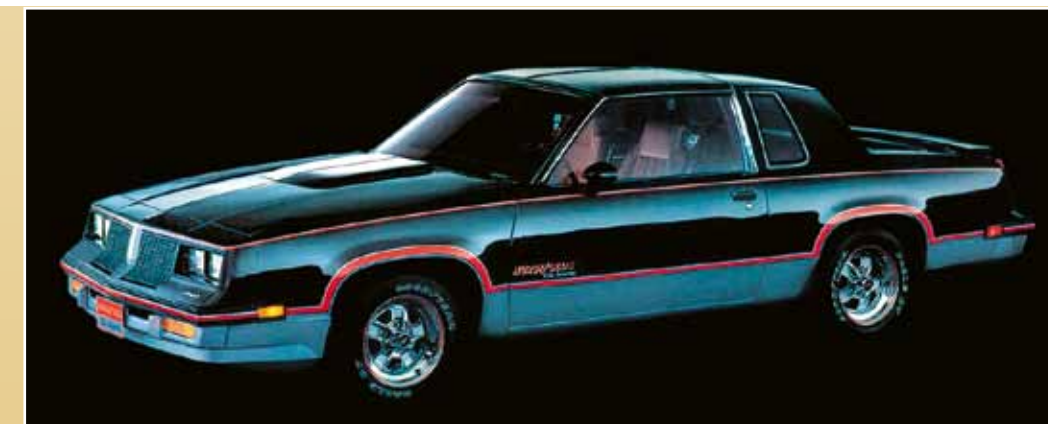
Až do 80. let se stavěly speciální limitované edice, například tento Oldsmobile Hurst/Olds 15th Anniversary (1983) s osmičkou 307 cu.i. a automatikou. Voliče „Lightning Rod“ byly samozřejmostí

tu a přinesla výsledný čas jedenácti sekund.