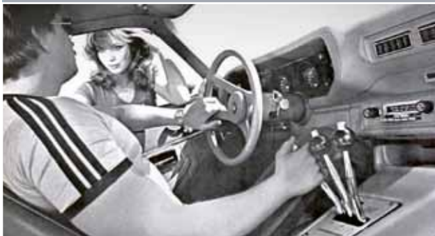
Hurst „Lightning Rods“ byla efektní soustava třech oddělených voličů

agregát, k tomu jedna řadička, dva otáčkoměry, dvě sady měřáků teploty a tlaku oleje, a dokonce i dvojice plynových pedálů! Díky kompresorům 6-71-GMC, modifikovaným u Cragar Equipment (jeden ke každému motoru), vznikla bestie s výkonem 2.400 koní, ale zároveň dragsterová čtyřkolka, jejíž přední i zadní kola se po celé délce dragstripu zakusovala do asfal-