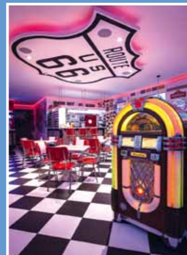
Stylovou americkou náladu doplňuje jukebox se spoustou hitů z padesátek