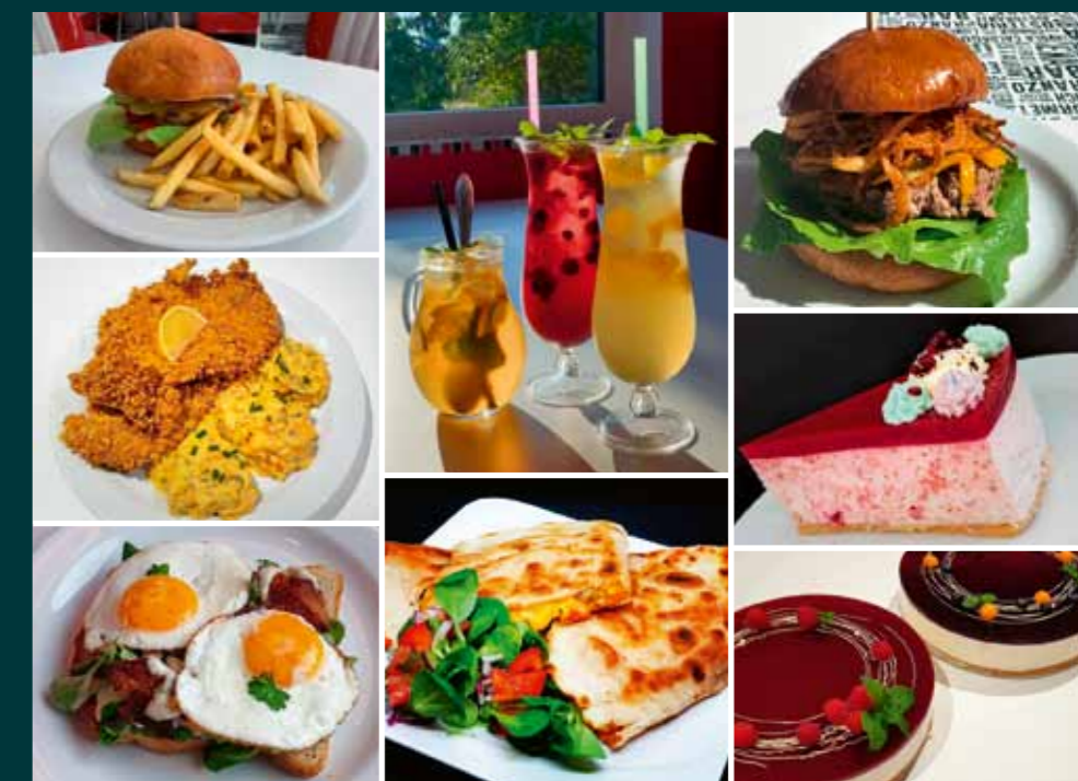
Jako v každém správném americkém dineru i zdejší gastronomie stojí na sendvičích, burgerech a tex-mex pokrmech. Doplníují je pečená žebra, křídla či speciality v podobě Cozy Dogs. Jako sladkou tečku můžete mít domácí cheesecaky, lívance s javorovým sirupem, milkshaky nebo domácí limonády. V dobách covidových omezení funguje bezplatný rozvoz se speciálním menu