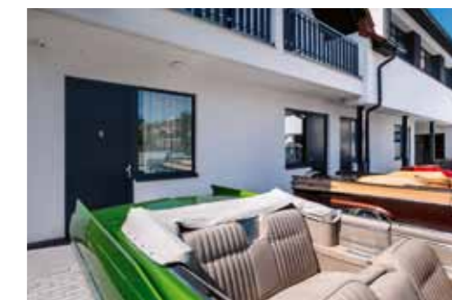
Průchodem k recepci můžete obdivovat prosklenou vitrínu s modely amerik