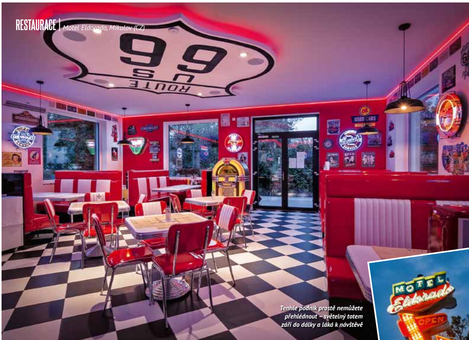
Tenhle podnik prostě nemůžete přehlédnout – světelný totem září do dálky a láká k návštěvě