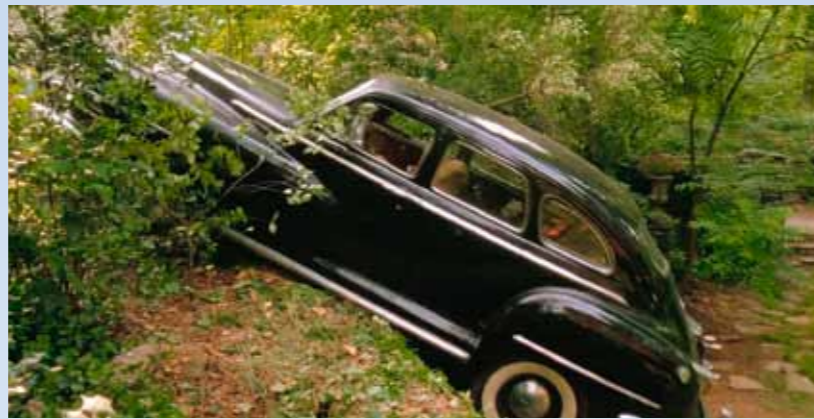
Rána jako hrom, Chrysler si sedl na břicho, zadní nárazník zaduněl o vozovku. Miss Daisy očima metá blesky, ale zachová klid. Turbulentnější povaha by auto nakopla, Daisy mu vyšle poselství očima