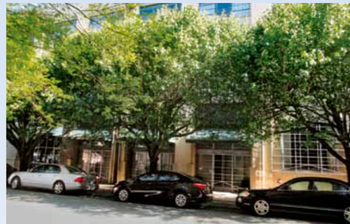
342 Nelson Street v Atlantě se od doby natáčení proměnilo víc než dost. Boolie ani Hoke by nepoznali, co to před továrnou stojí za divná vozidla, zmizelo i cihlové zdívo a zbytek zakryly vzrostlé stromy