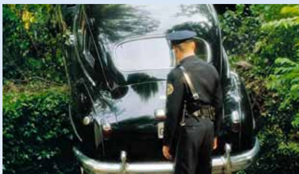
Místní policeman si evidentně o starých dámách za volantem myslí svoje. Jasně ale je, že se Chrysler bez pomoci odsud nehne, a i na navijáku má „šanci“ přinejmenším na poškození výfuku. Snímek to ale nerozdává...