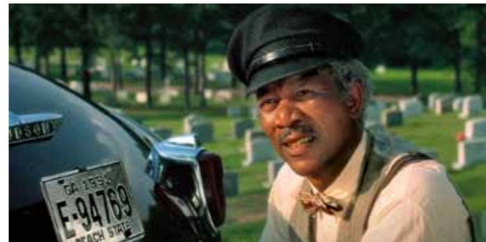
Během návštěvy hřbitova vyjde náhodou najevo, že Hoke neumí číst. A když je Daisy dlouholetá kantorka, Hokovi se ve zralém věku dostane odpovídajícího vzdělání. A Hudson? Ten je z každého úhlu úžasný...

Pokud divák bude dávat pozor, všimne si, že se auto, zaparkovaná v „druhém plánu“ opakují včetně záběru ulic. Je to obvyklý prohrěšek všech filmařů, kteří (marně) spoléhají na divákovu slepotu