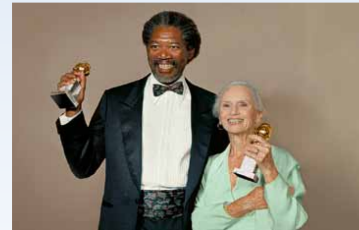
A „last but not least“ předávání Oscarů. Jessica Tandy září stejně jako dovedla ve své úžasné roli zářit Daisy Werthan, jedinečný Morgan Freeman je jí oporou jako filmový Hoke Colburn. Na snímek nelze zapomenout...