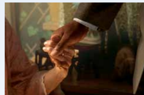
Nejintimnější gesto filmu, pochopení, láska, úcta, spojené ruce i srdce. Jste dojetím mimo? Nestyďte se za to. Je to normální, když je člověk v téhle podivné době vystavený silnému citu, byť ve filmových kulisách...