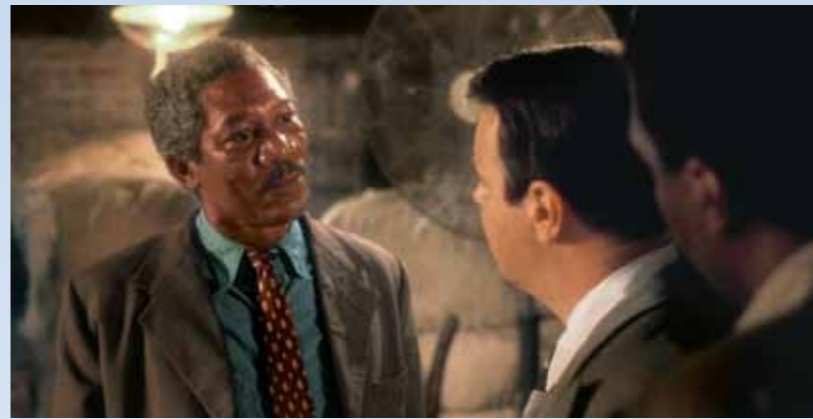
Na scénu vchází budoucí řidič: právě exceloval v roli zachránce dělníků, které polapil uvízlý výtah. Dovidáme se, že je to jen taková finta. Na Boolieho Hoke udělá dojem, protože umí něco, co není v příručkách...