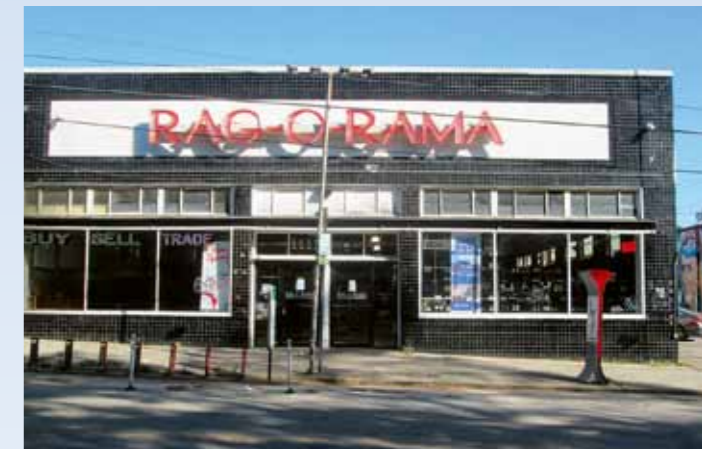
Filmový supermarket Piggly Wiggly, kam Daisy poprvé jela nakoupit Hudsonem, se proměnil v reálně nevzhlednou budovu s evidentně více nájemci, místo telefonní budky, odkud Hoke volal, stojí poutač...