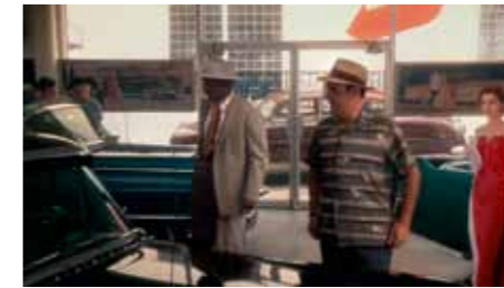
Divák ještě netuší, že Hoke si Daisyin Hudson koupí od prodejce na splátky. Za pár let bude mít raritnější vůz než Daisy, a pokud by ho nedal do šrotu, měla by jeho rodina dnes poklad. Ale to je jen teorie