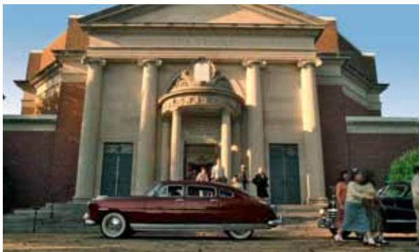
Před židovskou modlitebnou jí Hoke s čepicí v ruce otevře dveře Hudsonu. Jako když píchne do vosího hnízda! Ale slečna Daisy pozná až později, že jí takové gesto dodá další ingredienci high society...