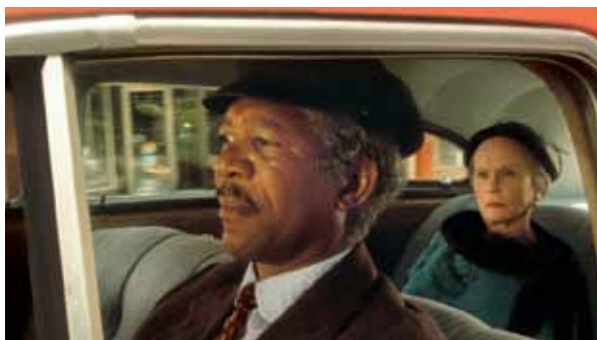
Typický výraz nesmlouvavé učitelky v penzi, ale její řidič evidentně zná lidské povahy lépe než ona. Ví, kdy jí musí nechat vychladnout, kdy má mlčet, ale kdy jí může vrátit míček nějakou pikantní odpovědí