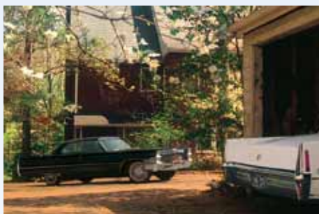
Stárnoucí Hoke přijíždí k Daisy už v modrém Calais, který odkoupil, zatímco do garáže se nevejde nový bílý Fleetwood 60 Special. Na jeho jízdy bude divák čekat marně, Caddy je už jen statická dekorace