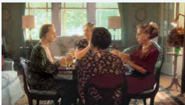
Pravidelnou a zřejmě jedinou zábavu upjaté dámy jsou karetní dýchánky v kroužku dam stejné společenské třídy. Probírá se tady úplně všechno, často také prohřešky syna a jeho mladé a vítální ženy