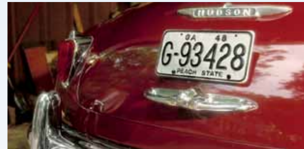
Na scénu se dostává Hudson. Úžasný, nadčasový a noblesní. Registrační značka Georgii nazývá Státem broskví. Fakt je, že se tam po lahodném ovoci jmenuje více míst, třeba ulice s filmovou modlitebnou