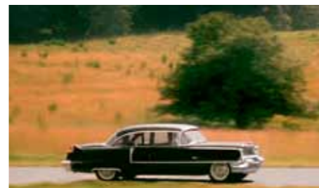
Krátce po nebezpečném průjezdu jednou křižovatkou, kdy po Cadillaku štekne houkačka plebejského Chevy jakousi nadávku, následují sekvence spíše zeměpisného charakteru. Ale dobře ilustrují pohodu v autě...