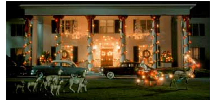
Ještěže my tady u nás máme Ježíška! Dědek Mráz zmizel v propadlišti, ale Santové pořád útočí. Domy jsou také ověšené svítícími cingrlátky, jen ta menažerie sudokopytníků spolu s rudými starci snad u nás není...