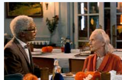
„Ale vy jste si ještě nevzala koláč,“ říká Hoke slečně. Na rozdíl od jejího syna a ošetřovatelek pochopi, proč. A pak už jen tichý pohyb vidličky se soustem a prolínačka na Cadillac. Konec cesty...