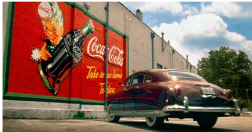
Před supermarketem jí Hoke musí dát klíče od Hudsonu, protože co kdyby? A když Hoke telefonuje z budky Booliemu, divák se královsky baví – samozřejmě tuší, že si scénárista nenechal ujít další „malér“