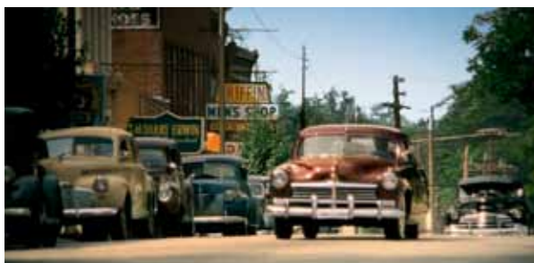
U chodníku béžový těsně předválečný Chevy a za ním vinové „cosi“, co vypadá trochu jako rod. Všimněte si širšího obutí, skoro zároveň s hranou výřezů kol. Černý Fleetmaster vzadu je velkolepý...

Pokud divák bude dávat pozor, všimne si, že se auto, zaparkovaná v „druhém plánu“ opakují včetně záběru ulic. Je to obvyklý prohrěšek všech filmařů, kteří (marně) spoléhají na divákovu slepotu