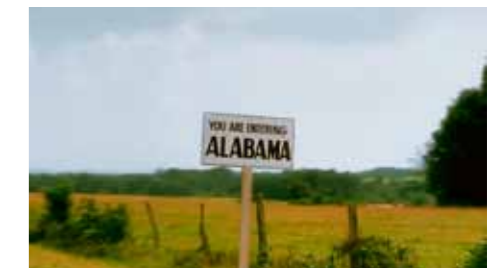
VSTUPUJETE DO ALABAMY, říká cedule. Cadillac jí mají bez povšimnutí, jen Daisy se v autě konečně rozpovídala. O své rodině, zesnulém manželovi a trochu i o životě. Hoke jí kontruje svými zkušenostmi...