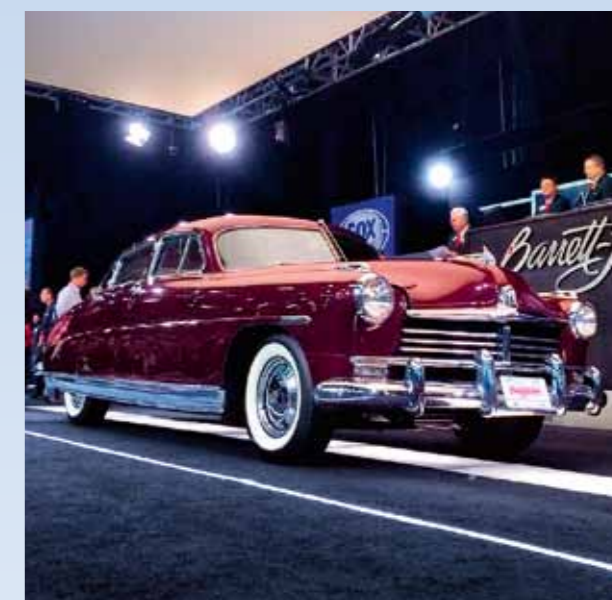
Originální filmový Hudson Commodore Eight '49 se v roce 2014 dostal do aukce společnosti Barrett-Jackson, odkud odjel k novému majiteli za 60.000 dolarů. Součástí vozu byly i filmové suvenýry

Snímek viděli první diváci 15. prosince 1989, v lednu roku příštího jej dis-