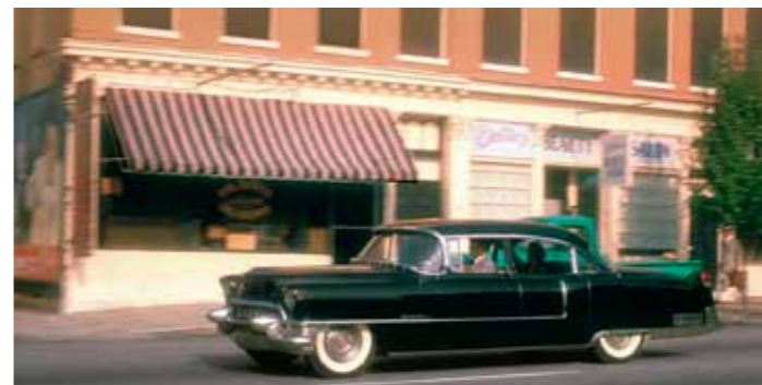
Jízda do Mobile začala sérií příkazů, jakou rychlostí se má Cadillac „řítit“ – a také kudy. Daisy má totiž mapu. Jak to dopadne, diváci už většinou tuší, protože Daisy je ze silniční sítě evidentně nesvá