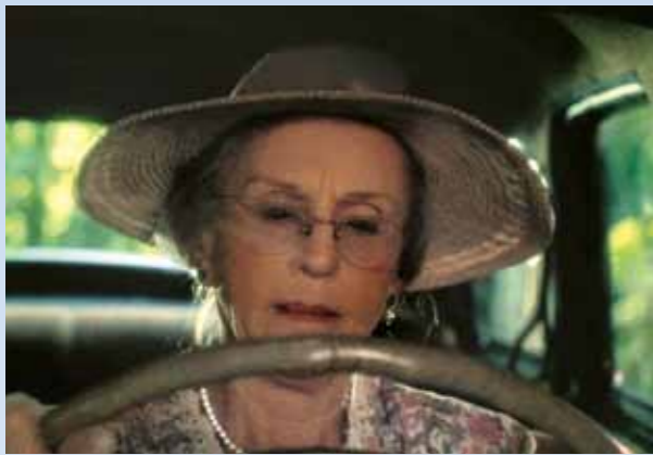
Tak ještě jednou děj od začátku: ruka v pletené rukavičce zasune titěrný klíček do spínačky, pravice si pohraje s řadičkou, Chrysler začne couvat. A couvá pořád, dokud se zaduněním neskočí z meze...