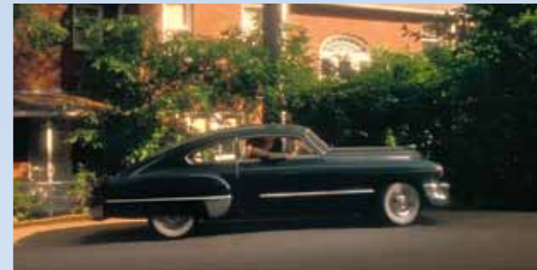
Tohle bude „veliký“! Divák už samozřejmě ví, co se děje, a čeká na další děj. Také pátrá, odkud slečna kouká, co jí to zase ten nemožný kluk veze. Ten totiž podle Daisy vždycky přijede nevhod a chová se nemožně!