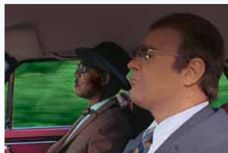
Cestou do luxusního starobince v nejnovějším 300 SEL, který si Boolie pořídil asi proto, aby se naučil vážit si pohodlí Cadillaků. Hoke neříká, jediná spravedlnost, která na světě panuje, mu také pohnula s časem