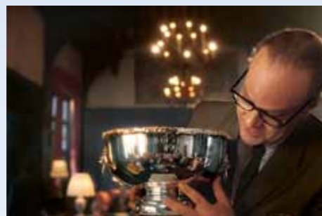
Na samotné elegantní slečně a ani na Hokovi nepozorujeme běh času. Maskéři odvedli dobrou práci. Zato Boolie v každém výstupu o něco zestárne. Tady přebírá cenu Muže roku a jeho léta jsou znát