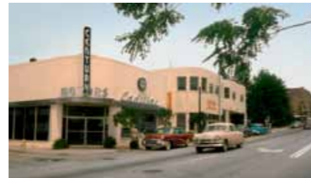
Za béžovým Fordem '51 přijíždí Hudson k prodejce Cadillaců Century Motors. Caddy je pojem a Hudson tou dobou už slábnul. Ovšem následující roky by jeho hodnotu prověřily. Leč Amerika je Amerika