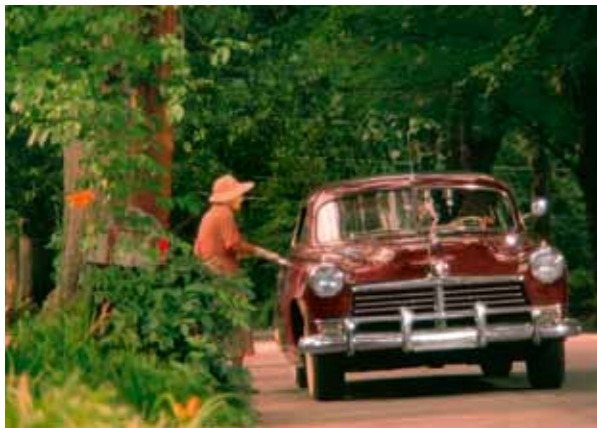
Preventivně vynadá Hokovi (co kdyby za něco mohl?). Marně jí řidič přesvědčuje, že zná kratší cestu. I kdyby se mělo jet přes Kanadu, bude po jejím. Ale vyhodit Hoka nemůže, platí ho Boolie