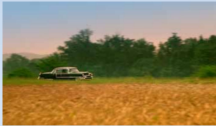
Krásný pohled na Cadillac, ženoucí se kolem lánů dozrálého obilí. Je krásně vidět úžasnou proporcionalitu karosérie i její vyváženost. Na druhou stranu: jak by v téhle kulise vynikla silueta proudnicového Hudsonu?