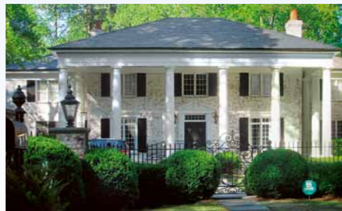
Daisy měla při spatření monstrózních kýchů strach, aby nemusela evakuovat obsah svého žaludku. Boolie si pořídil nový dům, v němž určitě využije tučtý počet ložnic a stejný počet koupelen. Merry Xmas, Boolie!