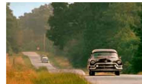
Žluté vodorovné značení prý v oné době neexistovalo. Snad by to nebyla byla tak zásadní položka je ve filmových úsecích načas přetřít či odstranit... Ovšem divákovi se kladou onačejší „chytáky“ k přehlédnutí