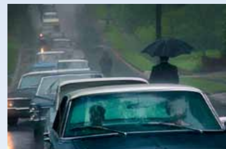
Scénář nedal divákovi nahlédnout na další změnu auta, ale v koloně, zaviněné výbuchem nálože, může poprvé vidět Cadillac Calais '65. Je druhá polovina šedesátých let a spořádaná Amerika je tatam. Navždy...