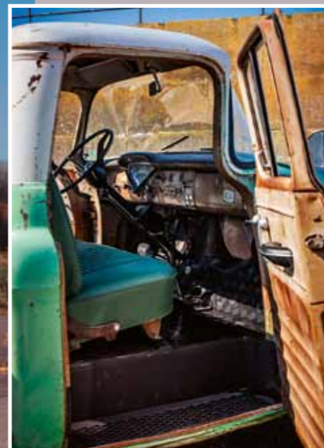
Při pohledu na lak, sedřený a vyšisovaný sluncem, nemůžete očekávat kabínu čalouněnou kůží Conolly. Interiér je čistě pracovní a takový už zůstane, můžete sem i přímo z pole nebo blátivé cesty