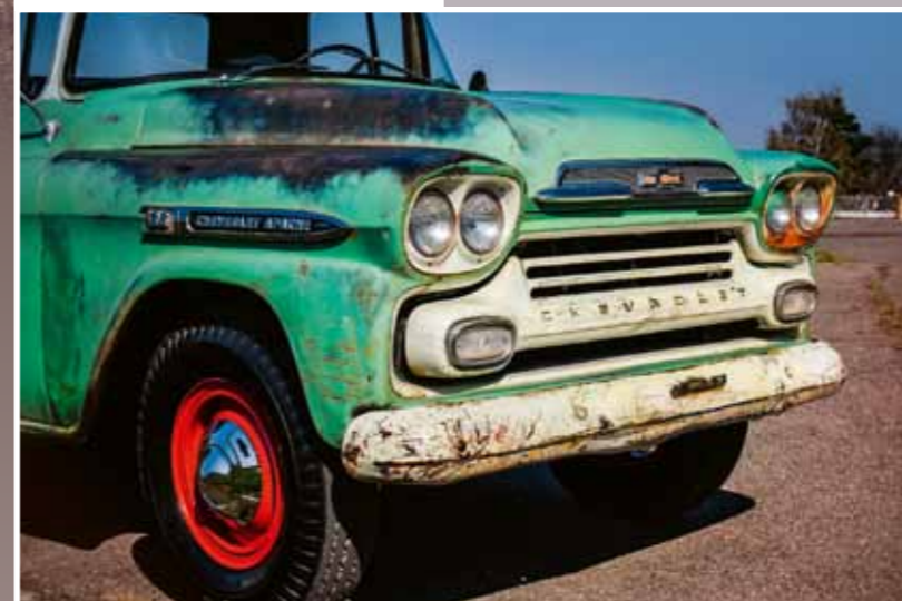
Dva páry světlometů dostal light truck Chevy počínaje ročníkem 1958. Původně bíle lakovaný nárazník dnes nese šrámy a stopy mnoha „soubojů“. To, že dodnes žije, znamená, že se nevzdal. A to je moc fajn

Každý majitel starožitného auta (o muzeu nemluvě) by se měl těšit podpoře rodiny... „Manželka muzeem provádí návštěvníky, takže musí vědět všechno, musí znát odpovědi nejen na otázky