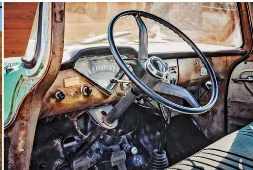
Kombinovaný přístroj ve tvaru trojúhelníkového výřezu slavil premiéru v řadě Bel Air 1955 a současně se objevil i jako novinka v pick-upech Chevrolet stejného modelového ročníku

Zespu je Apache lepší než v dobách svého zrodu. Všechno je kompletně zgenerálkované, opatřené ochranným nástřikem a přezkoušené. Pick-up ročníku '59 je nemyslitelný bez tuhé zadní nápravy a listových per