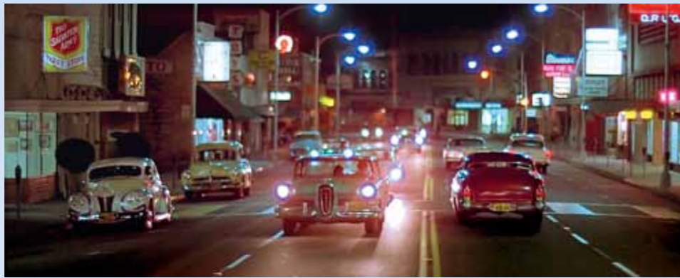
Krásné dobové souhvězdí: zcela vlevo kustom Ford V8, za ním jeho poválečný brácha ve verzi STW, proti kameře jede Edsel Corsair a v jeho protisměru se vzdalují Pharaohs se svým leadsledem Mercury