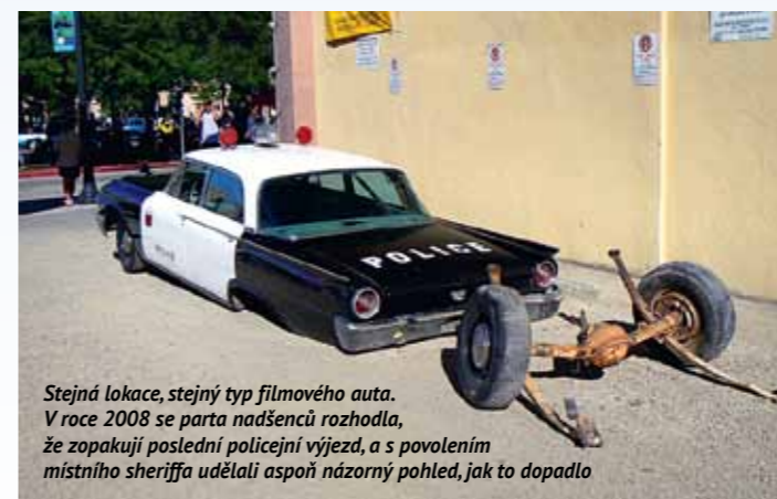
Stejná lokace, stejný typ filmového auta. V roce 2008 se parta nadšenců rozhodla, že zopakují poslední policejní výjezd, a s povolením místního šeriffa udělali aspoň názorný pohled, jak to dopadlo