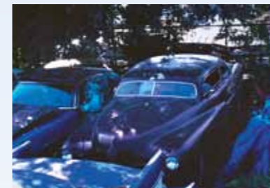
Smutný snímek leadsledu od Pharaohs. Jeho newyorský majitel v něm z nešťastné lásky spáchal sebevraždu, rodiče pak celou jeho kolekci odvezli na junkyard. Říká se, že auto kdosi zachránil, jistota ale není...