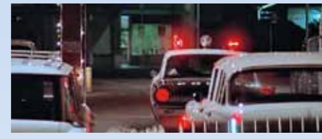
Majáky zablikaly a policejní Ford Galaxie '61 vyráží do útoku. Dvojice strážníků netuší, že nízký leadsled se řvoucí partou Pharaohs byla jen vábníčka. Curt splnil svůj „přijímací“ rituál naprosto bezchybně