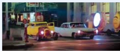
Teď dojde na žertíky! U křižovatky přistál dívčí Caddy Sedan De Ville a začne divadlo, které pokračuje na spodních dvou fotkách. Cadillac vypadá, jako by byl těsně před kustomizem. Chybí hlavně chromy...