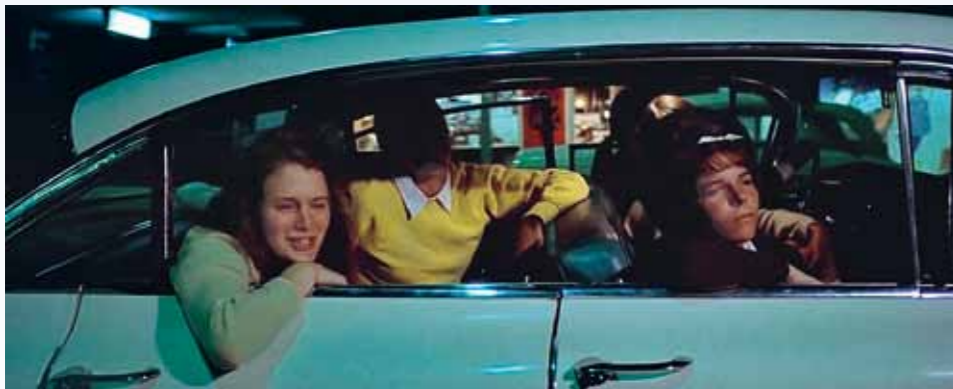
Cadillac je sice „filmově“ dva roky starý, ale už toho má asi dost za sebou. Děvčata ještě netuší, že jim škodolíbí přátelé znehyní auto přímo před vjezdem do křižovatky. Ovšem flattop by byl hezcí...