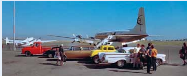
Závěrečná scéna se točila na Buchananově letišti 3. srpna 1972. Mimo známých aut určitě zaujme zlatě metalizovaný Chevy Nomad, stroj DC-7C pronajala firma Magic Carpet, jejíž logo je zřetelně viditelné

chovaných snímků, ale ozývají se hlasy, že z vrakoviště byl před rokem 2010 vyproštěný a odkoupený. Jeho eventuální