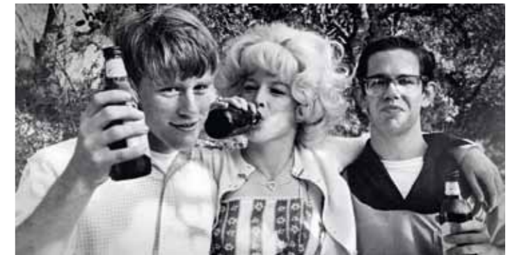
Všichni jsme byli takoví... Pivo z flašky, kočku u pasu, jen ty ameriky nám „trochu“ chyběly. Ale na druhou stranu jsme před sebou neměli perspektivu bojů ve vietnamské džungli bez zpáteční jízdenky...