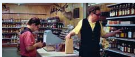
Nějaká ta cukrátko do sáčku, živý kačky a různé pochutiny, co Liquor Shop nabízí, ale hlavně tu whisky! Ale to už prodavač zvedá obočí jak štítý Rocky Mountains, blyškne brýlemi a výmluvně flašku vrátí zpět...