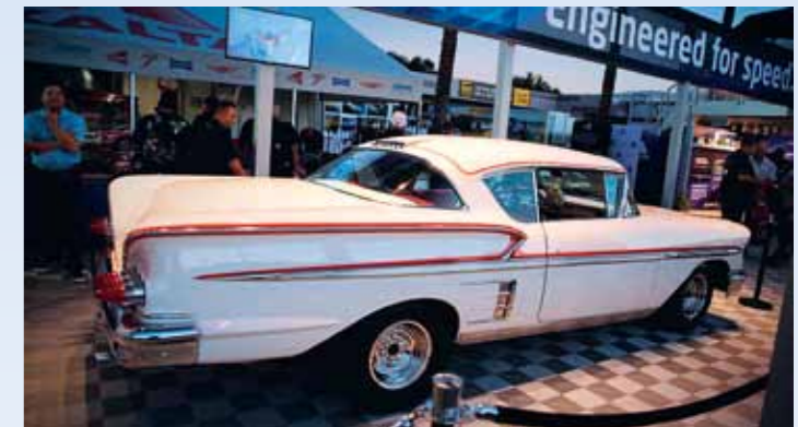
Steveova Impala '58 na jedné z výstav filmových dopravních prostředků. Její dnešní majitel ji koupil za 325 dolarů, půjčených od táty. Řadit neuměl, takže cestou domů na jedničku málem zlikvidoval motor