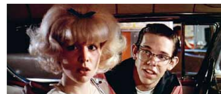
Candy Clark byla v době natáčení 26 let, ale s přehledem si stříhla naivní blondátou osmnáctku. Jen při záběru zblízka nemilosrdná kamera odhalila, že ten „filmový“ věk už bude nějaký ten rok za ní