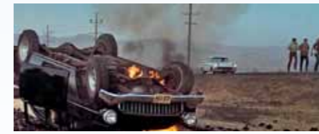
Divák nevidí otočení Chevroletu jeřábem a umělý oheň. Určitě si ale zapamatuje, že černý 150 je skloněný na kapotu a má otevřený zavazadelník... Na silnici brzdi bílá Impala a všichni utíkají pomáhat Falfovi