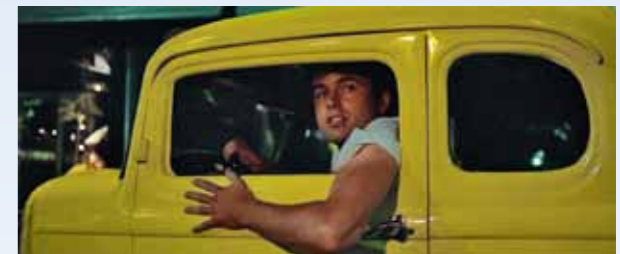
John netají svou nespokojenost: nastěhovala se k němu doslova „podměrečná“ Carol (Mackenzie Phillips), později známá v oblasti popu a country. Ale Johnovi se směje celé město!