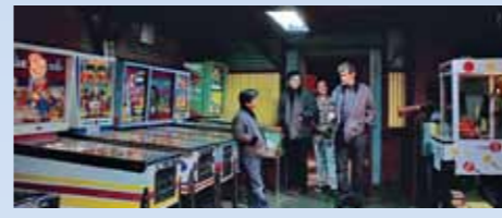
Pharaohs s přívěskem Curtissem přišli do herny, patříci Curtovu příbuznému. Tváře a postoje hodných hochů jim nějak nejdou. Ale větší škodu neudělají, spokojí se s obsahem kasiček z flipperů

No, není jich mnoho – přinejmenším těch původních, kopie se nepočítají, i když je pro úplnost také zmíníme. Žlutý Deuce byl po skončení natáčení nabídnutý k prodeji za cenu úprav, které do filmu podstoupil, tedy za 1.500 USD. Kupce ale nenašel, produkce jej tedy použila pro reklamu snímku a pak uschovala, protože už tehdy se začalo hovořit o druhém dílu, v němž se Deuce také objevil. Až poté jej v aukci koupil jistý Steve Fitch spolu s černým Chevy 150 filmového Boba Falfy. Dnes už má žlutý hot rod jiného majitele, který jej dokonce jistý čas používal k dennímu dojíždění do práce, ale pak jej svěřil do rukou Roye Brizia (jméno čtenářům