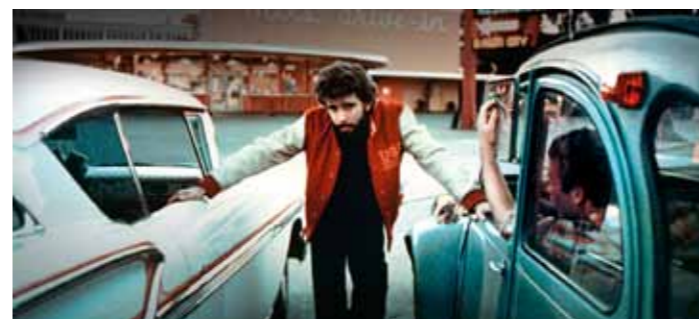
George Lucas během natáčení ukazuje tvář totálně vyčerpaného a zdrchaného člověka. Impala a „kachna“ jsou asi dva největší automobilové protiklady, v zrcátku Citroënu můžete vidět fotografa za přístrojem