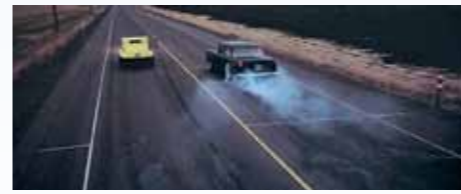
Záběr startu snímalo několik kamer a zkoušel se mnohokrát. Nevdržely dvě nápravy Chevroletu, černý One-Fifty byl prý v realu stejně nestabilní jako na plátně. Tam ovšem havárii zavinila prasklá pneumatika