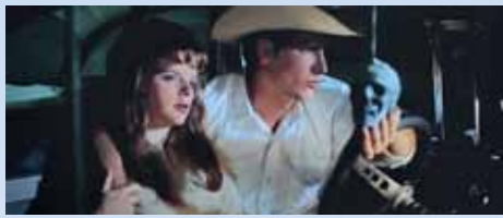
Sebevědomý Bob Falfa a k němu přitisknutá lehce ordinérní slečna, kterou krásně ztvárnila Debralee Scott. Falfa je svým způsobem král ulic, protože jeho nadupaný Chevy 150 prozatím ukázal záda každému