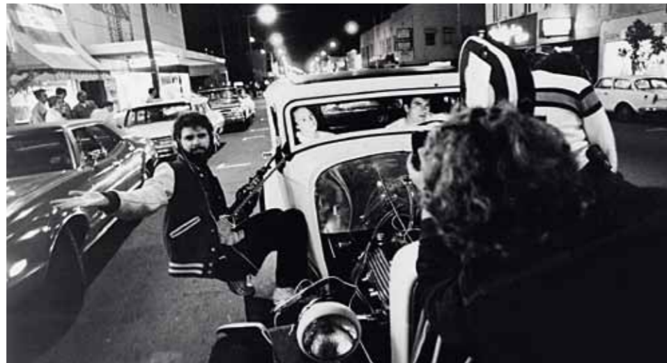
Záběr, kdy John Milner „veze“ Carol. Režisérovo připoutání je dobře vidět, Lucas si byl vědomý rizika, třebaže trailer nejel nijak rychle. Asistent kameramana tolik štěstí neměl, spadl, a musel do nemocnice