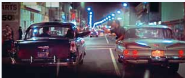
Konverzace se odvíjí nejen uvnitř v autech, ale také mimo ně. Je to tím, že tehdy nebyly „chytré“ telefony, ale chytrí konstruktéři. Navrhli taková auta, která poslouží v životě i ve filmu, a ještě udělají radost...