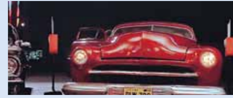
Zajímavá perspektiva přidě Mercury 1951. Merc po natáčení prošel rukama Eddieho Van Halena a poté Briana Setzera z kapely The Stray Cats. Po sebevraždě dalšího majitele skončil na vrakovišti...