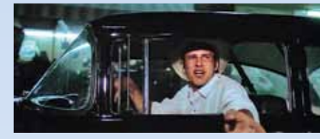
Harrison Ford v době natáčení už překročil třicítku a měl za sebou už sedm filmových rolí. Jeho Bob Falfa se rád nechal vyprovokovat k silničním závodům a rád také provokoval jiné. Jeho Chevy uměl...