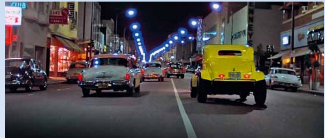
Jednou z několika dějových linek snímku je cruising – sem a tam, na konec města a zase zpátky, zdánlivě beze smyslu. Ale ten je právě v tom požitku z jízdy, motory bublají téměř na volnoběh, kámoši jsou nablízku...