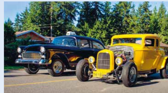
Slavnostní setkání: Deuce přečkal první i druhé natáčení a měl štěstí na majitele. Dnes má mnoho nového, ale září. Chevy je jediným přeživším z původní trojice a stále si zachovává potenci svého 454 cu.i.