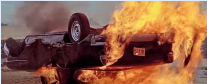
Nesmírná odvaha! Záhadná bytost zavřela před explozí zavazadelník, a ještě si pohrála s předním levým kolem. Nejlépe prý ale hořel dřevěný sloupek B, protože vrak Bel Airu byl původně hardtop... ☺