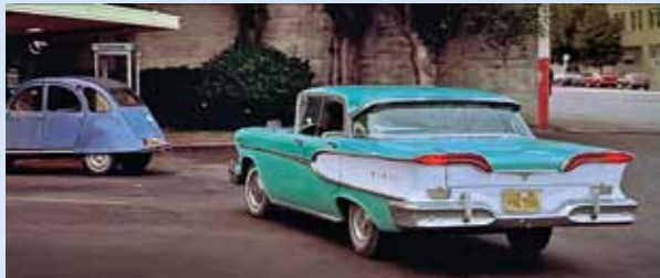
Slečny s nádherným Edselem spatříme během filmu často. Edsel sice v době natáčení ještě nebyl „úředně uznaným“ oldtimerem, ale stal se jednou z hvězd filmu. Škoda jen, že se nedočkal dneška...