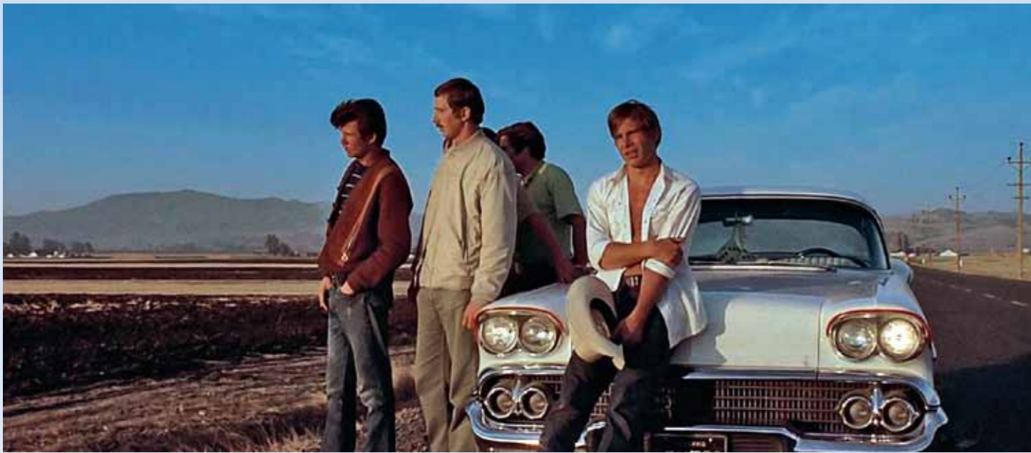
Pošramocený Falfa si drží evidentně zlomenou ruku a opírá se o Impalu. Z pohledu je ale jasné, že minimálně stejně zlomené má i srdce, když vidí, jak plameny stravují jeho vypiplaný Chevy '55