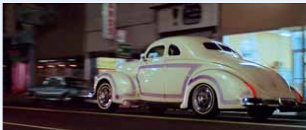
Pozoruhodně kustomizovaný těsně předválečný Ford V8 Coupe se ve snímku objevil v jednom delším záběru a několikrát „náhodně“ u chodníku. Údajně patřil známému Henryho Traverse z Petalumu