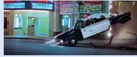
Výfuk i s tlumičem, zadní náprava, kardan, všechno letí do... (ano, přesně tam! ☺). Ale poprvé Amerika tenhle žertík viděla v seriálu „Leave it to Beaver“, premiérově vysílaném v roce 1963