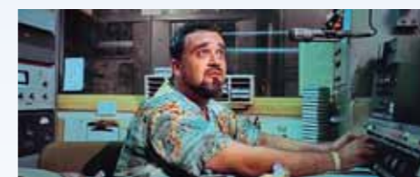
Rozhlasový DJ (Wolfman Jack) vyšel Curtovi vstříc a vyslal do éteru vzkaz pro neznámou krásku v bílém T-Birdu. Pro Jacka to byla první filmová role, ale zhoubná choroba jej poslala na věčnost už v roce 1995