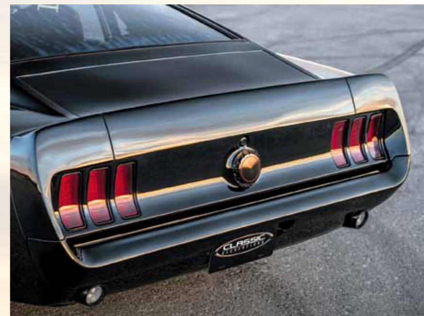
Zadní svítelníky jsou seskupené do dvou tradičních trojic a osazené LEDkami

Rok 2019: Měsíc i Mars v lidmi víceméně nedotčeném stavu, suroviny na Venuši stále jen bublají, antigravitaci zažívají zpravidla jen ti, kdo to přeženou s bourbonem... Už už chceme odmítnout i ten Mustang, když se zdá, že ozve zvuk, známý ze závodních oválů, a než stačíme vyslovit kletbu, z tečky na obzoru se stala nízká placka na širokém obutí, s nezaměnitelnými tvary, známými, ale přesto jinými... Nad kapotou se tetelí rozžhavený vzduch... Překvapení ročníku 2019 je zde! Kdysi se mu říkalo „King of the Hill“. Na přímou objednávku koncernu Ford jich specializovaná závodní stáj Kar Kraft