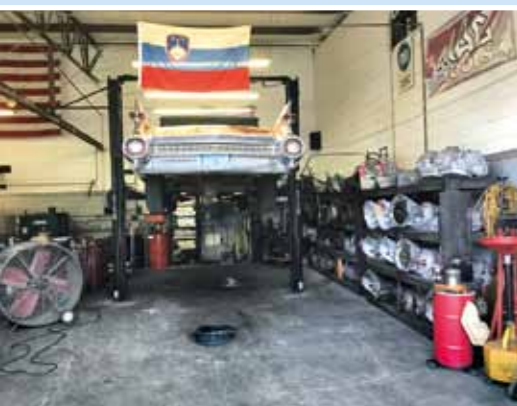
Pokud nechcete nic podcenit, bez zvedáku se bohužel neobejdete