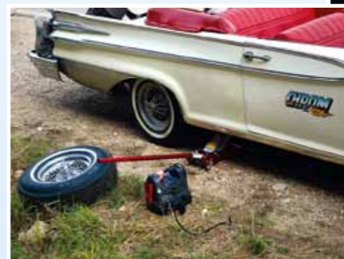
K nelehčím činnostem patří výměna prasklé pneumatiky