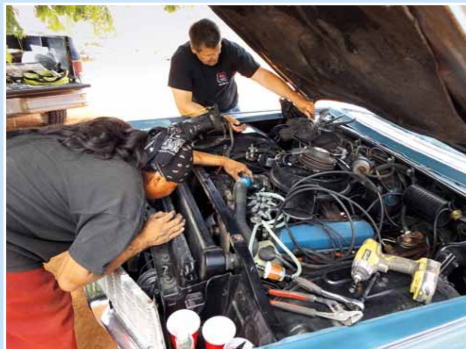
Ruku k dílu pomohli přiložit i indiáni. Samozřejmě za dolary!

míst obchody počínaje a stylovými dinary konče. To vše patří ke koloritu cesty po Route 66. My obvykle najedeme minimálně 5 000 kilometrů a dle toho bychom měli připravit svůj vůz na cestu. Výměna všech provozních kapalin je počátkem přípravy na tuto cestu. Je velice vhodné zkontrolovat všechny trubky a hadičky. Hlavně ty brzdové. Auta z padesátých a první poloviny šedesátých let disponují pouze jednookruhovými brzdami. Už jsme zažili šok, kdy takové brzdy odešly. Dále doporučuji důkladnou kontrolu všech teplovodních hadic v motorovém prostoru. Není nic otravnějšího, když musíte v parném