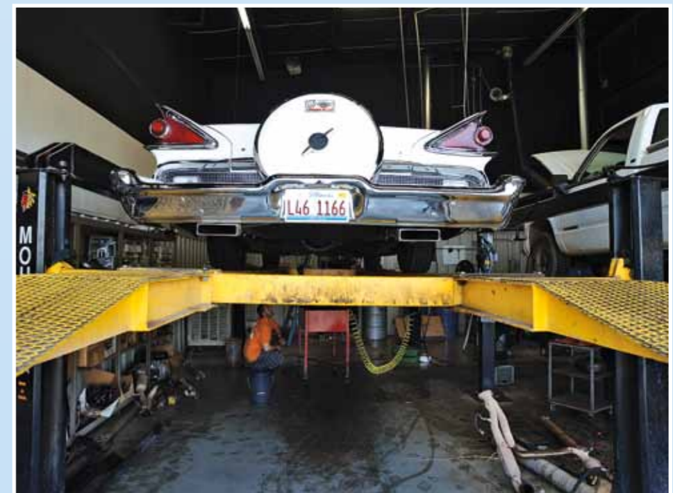
Repase převodovky do jednoho dne? I takové zázraky se tady dějí

důležitější je, že máte jistotu nového obutí. Jednou jsem se nechal kamarádem přemluvit, že má moje auto „dobré gummy“, ať tedy utratím své prostředky účelněji. Bohužel hned druhý den cesty jsem přišel zhruba o čtvrtinu běhounu. Jak to, když byla pneumatika dle vzorku téměř nejatá? Jednoduše. Auto jsem koupil od staršího sběratele, který neměl čas pravidelně projíždět svých šedesát aut. Můj Mercury Park Lane 1959 bohužel stál delší dobu na vypuštěné pneumatice, a tím ji neodvratně poškodil. Při jízdě se zahřála a má radost z ušetřené investice byla v kelu. Co ovšem dělat, když nemáte v Americe dobré známé, kteří by vám pomohli s výběrem auta, potažmo s domluvou nějaké autodílny? Na to je těžké hledat odpověď. Může vás také potkat i případ, který jsem zažil posledně, a sice to, že vám leží v Kalifornii nepojízdný