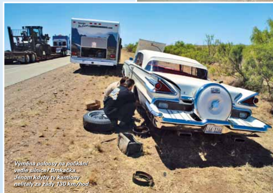
Výměna poloosy na počkání vedle silnice? Brnkačka. Jenom kdyby ty kamióny nelítaly za zády 130 km/hod.