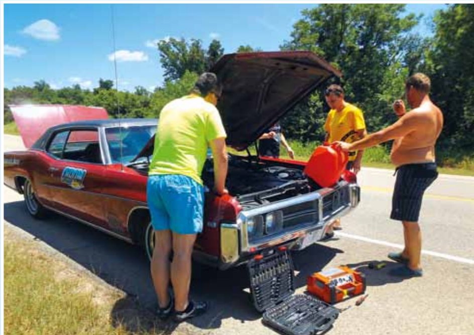
Rozprava během opravy. Proč ta mrcha stará pořád stávkuje?