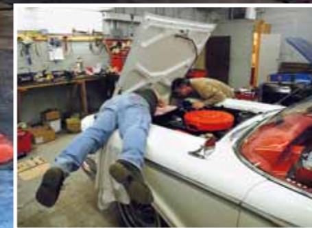
Je překvapivé, že náhradní díly na Cadillac roku výroby 1949 se dají stále sehnat

díči není vůbec voda. Po dolití vody a kontroly olejů se pokusili Caddyho nastartovat. Takový dým prý ještě nikdy nezažili. Celá křižovatka byla do minuty zakouřená. Motor zhasl a šli hledat příčinu. Jaké bylo překvapení, když do pěti minut policisté zavřeli křižovatku a na místo poté dorazilo osm hasičských vozů? Na jediné, co se boss servisu zmohl bylo, že zaklapl víko motorového prostoru (což ho později zachránilo) a šel se podívat ven na šou, která se tam mezitím děla. Vůbec netušil, že ty orgie byly kvůli nim. Policisté dostali hlášku, že hoří, tak jednali a ono nic. „Kdo to zaplatí? Jdeme hledat viníka. Je tady nějaký servis a před ním čumilové – mechanici. Koukneme se, co dělali v uplynulých