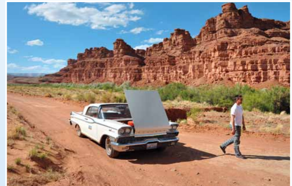
V teplejších oblastech se letitá technika značně přehřívá. Praxe nás naučila, jak se k autům chovat