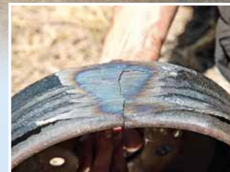
Brzdový buben po půl kilometrovém slajdu. No, kde to zažijete, přátelé?

jelo, jen zrovna když přijela odtahovka, tak se pokazilo. A že už je to můj problém. A že je seriózní, tak mně nebude účtovat parkovné po dobu, než si vyřeším jiný odtah. No, má cenu nadávat na mexickou verbež? Raději ne.