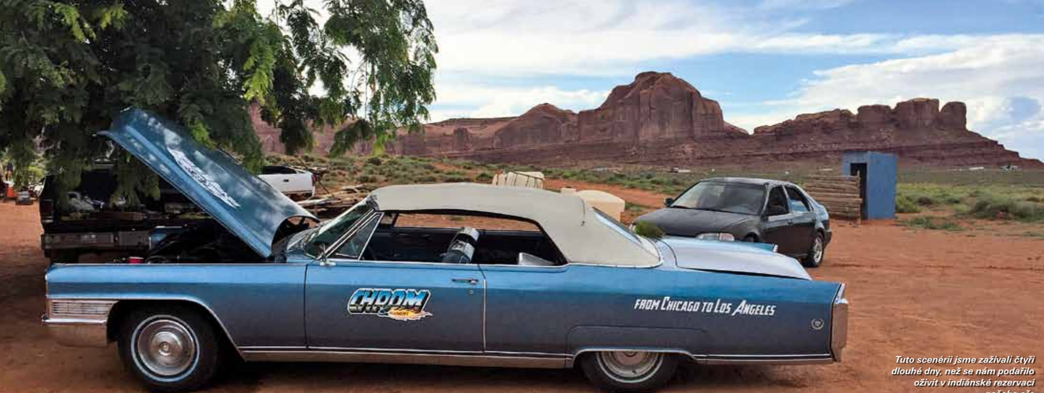
Tuto scénérii jsme zažívali čtyři dlouhé dny, než se nám podařilo oživit v indiánské rezervaci našeho oře