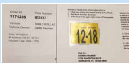
Prodloužení platnosti značky o jeden rok se může vyřídit po zaplacení poplatku, poštou. Sticker si nalep sám