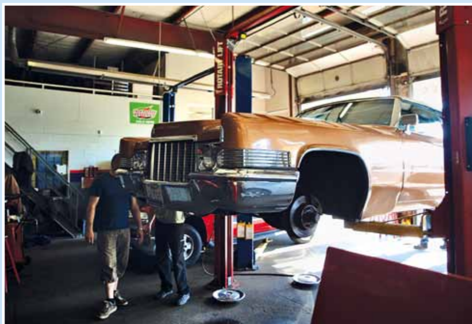
Když už jste u těch repasů převodovek do 24 hodin, tak bych také prosil jednu. Já si mezi tím skočím na stejk do Big Texanu