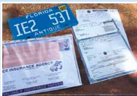
Title, značka a pojistka. Po těchto nezbytných formalitách můžeme vyrazit