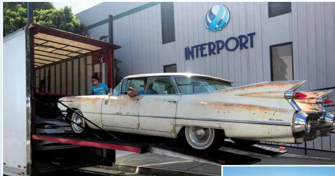
Odvoz v uzavřeném traileru