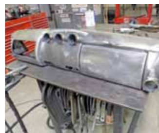
Původní palubovka Ford Dash '40 musela být upravena kvůli klimatizaci

zkoušek dostal povolení k odkupu agregátu, jehož se vyrobili pouhopouhé dva kusy. Motor nikdy neměl číslo a pro General Motors byl jen řadovou a dávno odepsanou položkou v nekonečném seznamu jízdních i dynamometrických zkoušek. Osmiválec 331 cu.i. se dlouho povaloval pod plachtou ve skladišti Speed Shopu, a ožil teprve v Billyho rodu – samozřejmě po pečlivé generálce u specializované firmy, která také vyrobila adaptér na automatiku TH350.