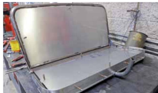
Trubkový rám a hliníkové plechy položily základ sedačce, o barvě a materiálu čalounění ještě není rozhodnuto