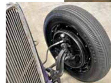
Přední brzdy jsou replikou lincolnových bubňů ročníku 1939, stavěnou u Bendixe