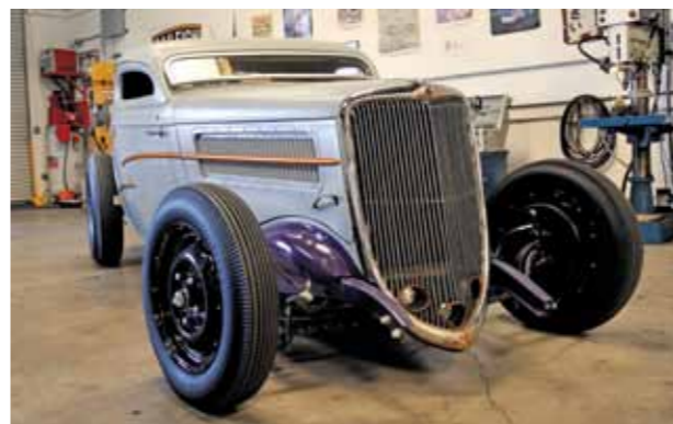
Stylové ocelové ráfky 5x16“ mají vzhled originálu z 40. let, dezén pneumatik Firestone musel podstoupit nějaké ty úpravy ke snížení hlučnosti