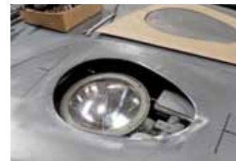
Nápad sklopného světlometu pochází z Billyho snu!