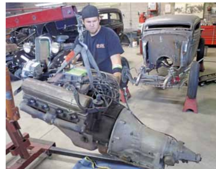
Díky adaptéru je možné zkombinovat exotický V8 s automatikou TH350