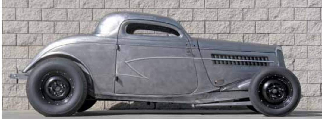
Takhle se Ford ukázal v roce 2011 – zbrúšený až na čistý kov

zkoušek dostal povolení k odkupu agregátu, jehož se vyrobili pouhopouhé dva kusy. Motor nikdy neměl číslo a pro General Motors byl jen řadovou a dávno odepsanou položkou v nekonečném seznamu jízdních i dynamometrických zkoušek. Osmiválec 331 cu.i. se dlouho povaloval pod plachtou ve skladišti Speed Shopu, a ožil teprve v Billyho rodu – samozřejmě po pečlivé generálce u specializované firmy, která také vyrobila adaptér na automatiku TH350.