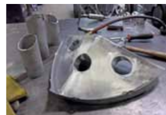
Přední maska je speciálně zhotovený kus pro montáž trojice LED světel

Jimmy Shine mívá dobré nápady, a některé z nich se zalíbily i Billymu Gibbonsovi. Ten si obvykle do svých představ nenechá moc mluvit, ale třeba Jimmyho konstrukce „skrytého odpružení“ přední nápravy byla zrovna takovou výjimkou. Přední reflektor viděl Billy ve snu a musel tuhle vizi nejdřív převést do reality, pak vysvětlit Jimmymu, a nakonec ho poplácat po zádech za doslovné „ztělesnění snu“. Abyste pochopili: ta přední lampa je jen jedna, zato