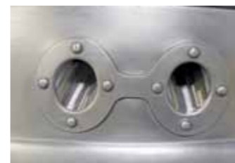
Otvory pro zadní svítelný stylově odpovídají ostatním prvkům