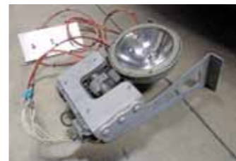
Reflektor má původ v letecké technice