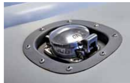
Ford „Whiskey Runner“ je sice strohý a spartánský, ale můžeme na něm obdivovat hodně zajímavých detailů