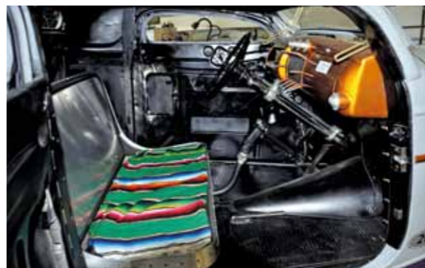
Když nemáte čalounění, poslouží poskládaná mexická přikrývka